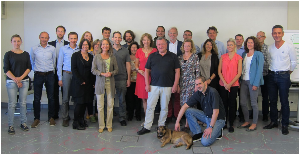
Abbildung 1: SUP-Team beim 5. Workshop

Die planerstellende Dienststelle (MA 48), die Wiener Umweltschutzabteilung (MA 22) und die Wiener Umweltschutzabteilung (WUA) als SUP-Umweltstelle nach Wr. AWG bildeten die SUP-Kerngruppe . Die Kerngruppe bereitete die SUP gemeinsam vor (z. B. Prozessablauf, Teamauswahl), traf Entscheidungen zu den Rahmenbedingungen (z. B. Zeitplan, Finanzierung), vertrat das SUP-Team nach außen und war für die Abstimmung mit der politischen Ebene verantwortlich. Die MA 48 übernahm die Federführung im Prozess.