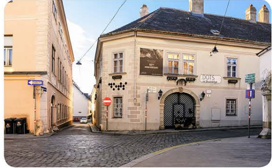
Torwirkung: Kahlenberger Straße / Greinergasse