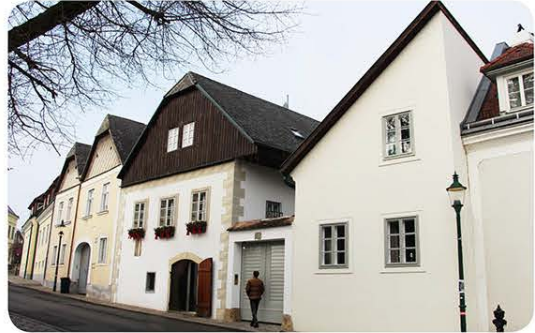
Giebelstellung zum Straßenraum: Kahlenberger Straße