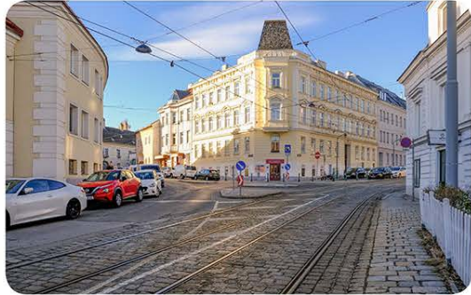
Platzartige Erweiterung des Straßenraums: Greinergasse