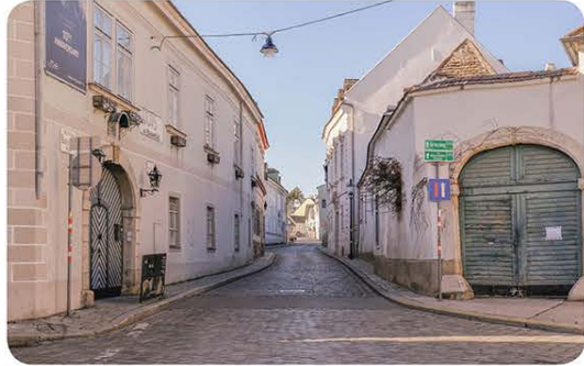
Markante Situation: Kahlenberger Straße