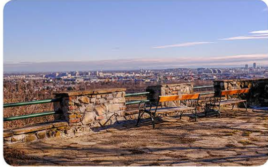
Aussichtspunkt: Eichelhofstraße, Blick vom Nußberg über Wien