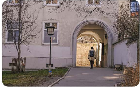
Wichtiger Fußweg zwischen Kahlenberger Straße und Hammerschmidtgasse