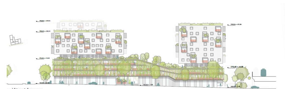
ansicht am tabo 1:200