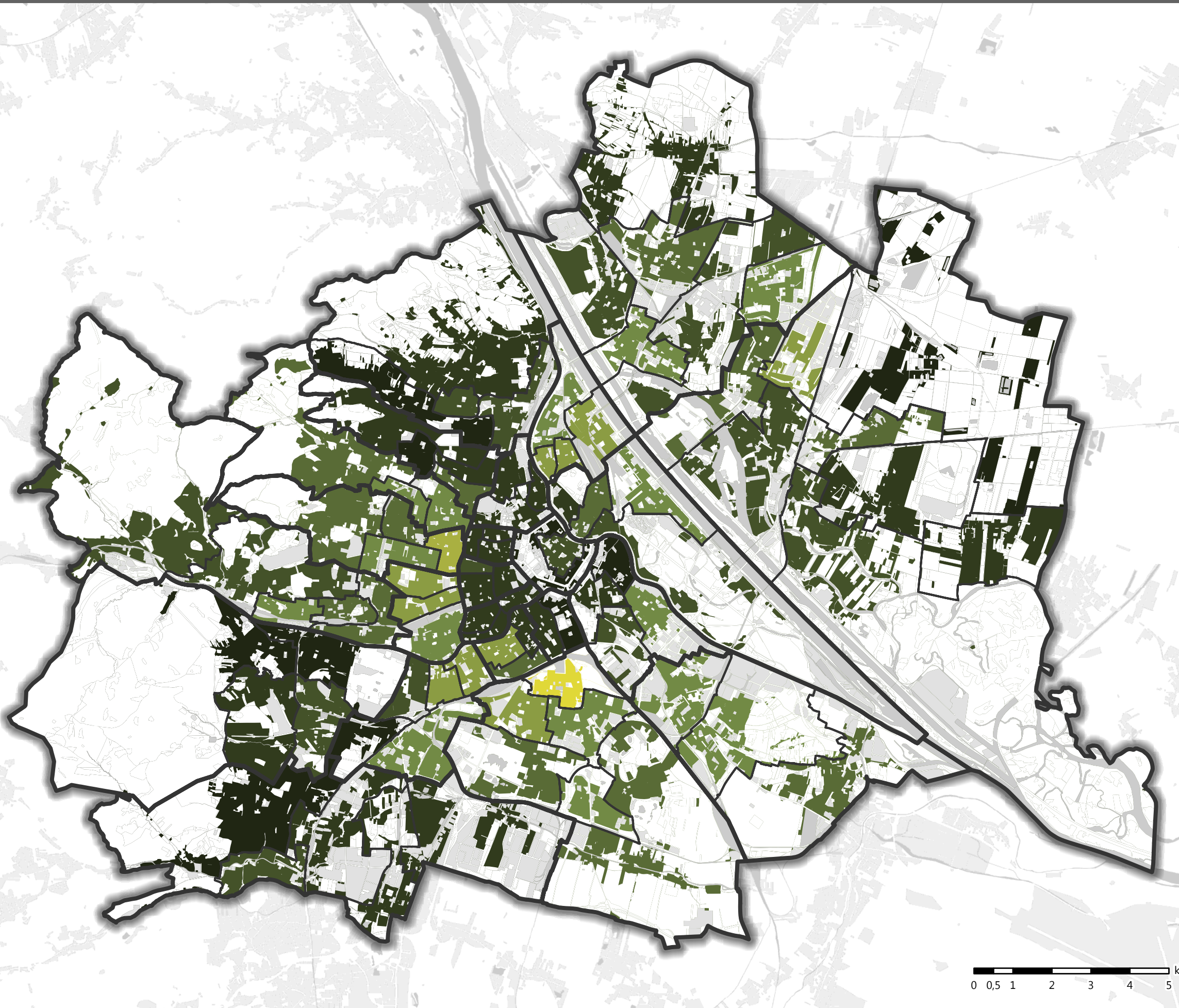
Zufriedenheit mit den Menschen in der Nachbarschaft nach 91 Bezirksteilen