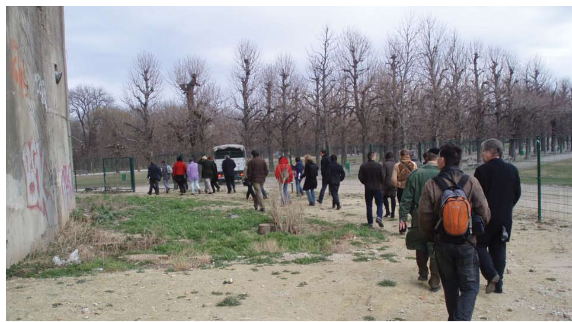
Eine von den Österreichischen Bundesgärten organisierte Begehung am 22. Februar 2008 führte AnrainerInnen und Initiativen auch auf nicht öffentlich zugängliche Flächen des Augartens und in das Innere des Flakturms.

Die ersten Treffen standen im Zeichen der zu Jahresende 2007 gefällten Entscheidung des Wirtschaftsministeriums für das Projekt eines Konzertsaals der Wiener Sängerknaben auf dem so genannten Augartenspitz. Dennoch konnten im Leitbildprozess Ziele und Maßnahmen für den gesamten Augarten und sein Umfeld entwickelt werden.