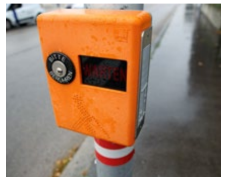
Zusatzeinrichtungen wie akustische Geräte erhöhen die Verkehrssicherheit.

vor allem für sehbehinderte und blinde Personen. Zur Verstärkung des Tick-Geräuschs bei Grünphasen sind Lautsprecher montiert. Die erste akustische Ampel wurde am 23. Juni 1972 an einer Kreuzung vor dem Blindeninstitut in der Wittelsbachstraße 5 in der Leopoldstadt installiert. Aktuell sind rund 80 Prozent aller Ampelanlagen mit Zusatzeinrichtungen ausgestattet. Dazu gehören tastbare Schilder und Bodenrillen, die ein sicheres Überqueren der Straße ermöglichen.