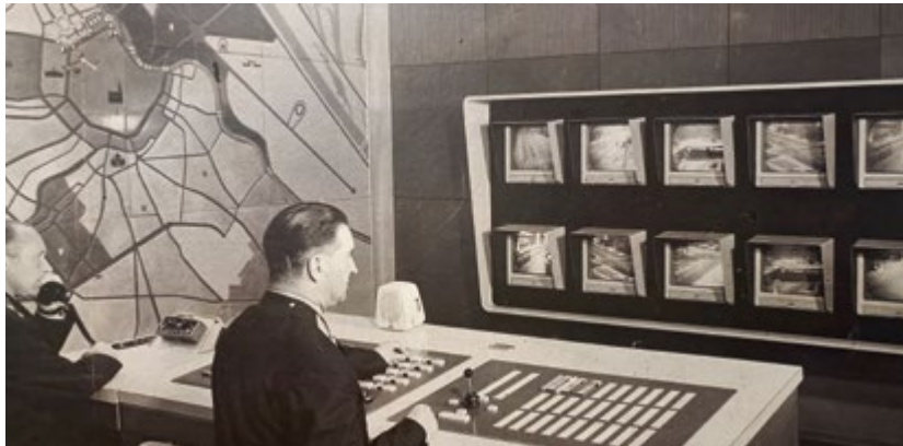
Die Verkehrsleitzentrale in der Rossauer Kaserne besteht seit 1962.

Stadtautobahnen Südosttangente und Donauuferautobahn an zwölf Standorten videoüberwacht. Das hat den Vorteil, dass bei Staus oder Unfällen von der Verkehrsleitzentrale eingegriffen werden kann. Dann reguliert die Polizei durch Programm-schaltung den Verkehrsfluss.