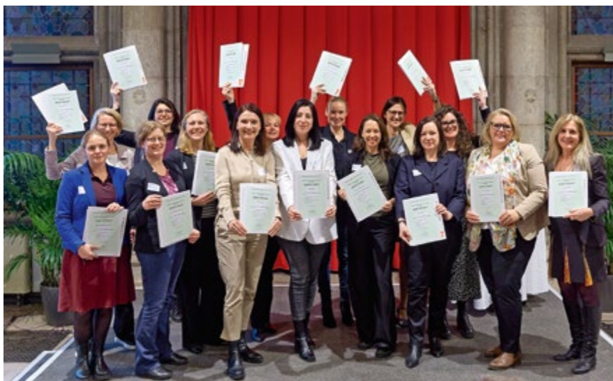
Abschlussveranstaltung mit Zertifikatsübergabe des ersten Durchgangs im Rathaus

„FRAME richtet sich an Frauen, die bereits Führungserfahrung haben. Ein Studium ist aber keine Voraussetzung, um dabei sein zu können“, macht