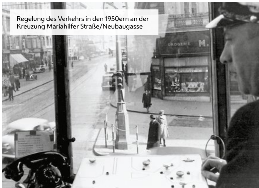
Regelung des Verkehrs in den 1950ern an der Kreuzung Mariahilfer Straße/Neubaugasse

Die Abteilung Wien leuchtet ist in der Stadt Wien für die Verkehrslichtanlagen zuständig. Die Bediensteten planen, errichten und betreiben die Ampeln. Aktuell wird in Wien der Straßenverkehr über rund 1.300 Ampelanlagen geregelt. Der zentrale Taktgeber der Ampelanlagen ist der Verkehrsrechner der Stadt Wien, der auch über die Verkehrsleitzentrale in der Rossauer Kaserne gesteuert werden kann. Diese technisch aufwendige und anspruchsvolle Aufgabe meistert die Verkehrsabteilung der Polizei. Die Zentrale verfügt über Rechner, die über ein eigenes Kabelnetz mit den Ampelanlagen verbunden sind, um sie computergesteuert zu koordinieren. Auf diese Weise werden Funktion und Betriebszustand überwacht und Störungen sofort identifiziert. An manchen Kreuzungen sind schwenkbare Videokameras mit Zoom platziert. Seit 1994 sind die