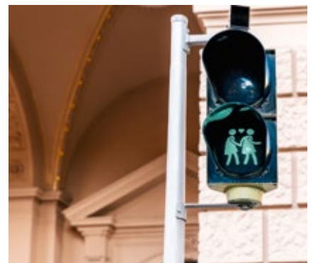
Seit Mai 2015 leuchten an manchen Lichtsignalen Ampelpärchen.

Heutige Ampelanlagen sind an exponierten Stellen der Hauptverkehrsrouten zum Teil mit einer „unterbrechungsfreien Stromversorgung“ für den Fall von Stromausfällen ausgestattet. Und 95 Prozent der Wiener Ampelanlagen sind bereits auf energiesparende und wartungsfreundlichere LED-Leuchtmittel umgerüstet. geschichtewiki.wien.gv.at/Ampel wien.gv.at/verkehr/ampeln