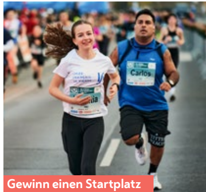
Gewinn einen Startplatz

A m 18. April bildet der Vienna 5K den Auftakt zum Vienna-City-Marathon-Wochenende. Gestartet wird am frühen Abend in zwei Wellen beim Schottentor. Die Strecke führt ein Mal um den Ring und endet vor dem Rathaus. Gehend, laufend oder walkend, mitmachen können alle, die die fünf Kilometer in maximal einer Stunde schaffen – mit offizieller Zeitmessung oder ganz ohne Platzierung.