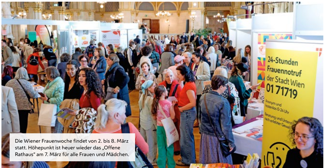
Die Wiener Frauenwoche findet von 2. bis 8. März statt. Höhepunkt ist heuer wieder das „Offene Rathaus“ am 7. März für alle Frauen und Mädchen.

geschichtewiki.wien.gv.at/Internationaler_Frauentag_wien.gv.at/frauen_wienerfrauenwoche.at