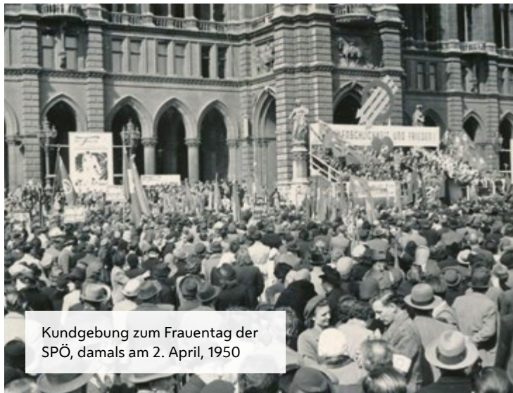
Kundgebung zum Frauentag der SPÖ, damals am 2. April, 1950