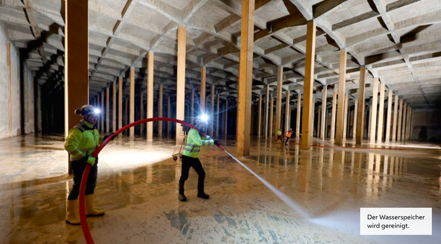
Der Wasserspeicher wird gereinigt.