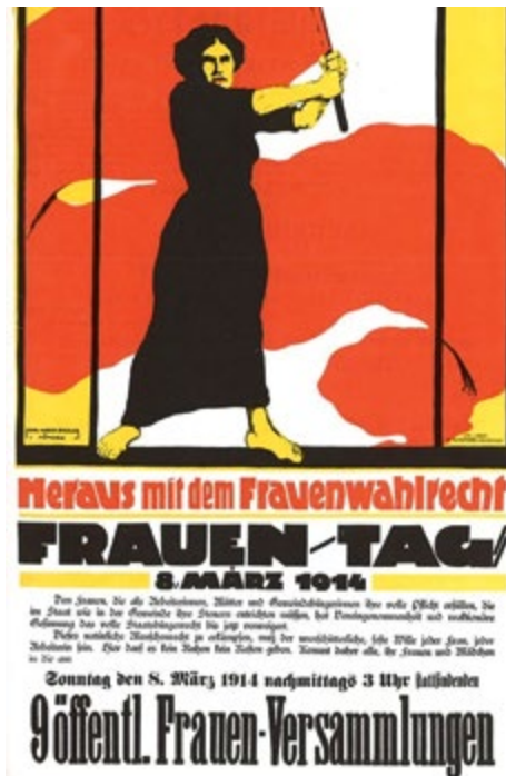
Aufruf für 8. März 1914 in München