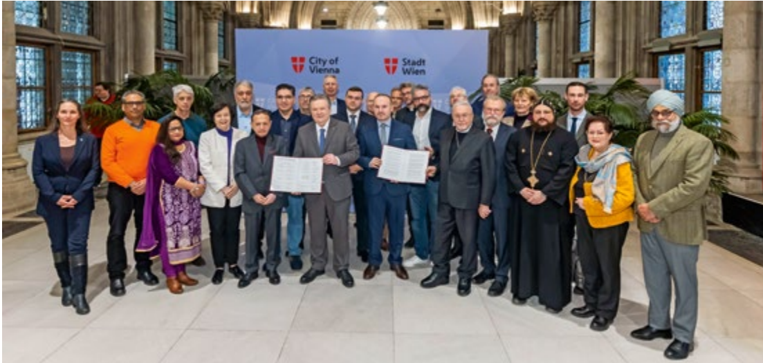
Bürgermeister Michael Ludwig diskutierte mit Vertreter*innen der gesetzlich anerkannten Kirchen und Bekenntnisgemeinschaften zentrale gesellschaftliche Themen.