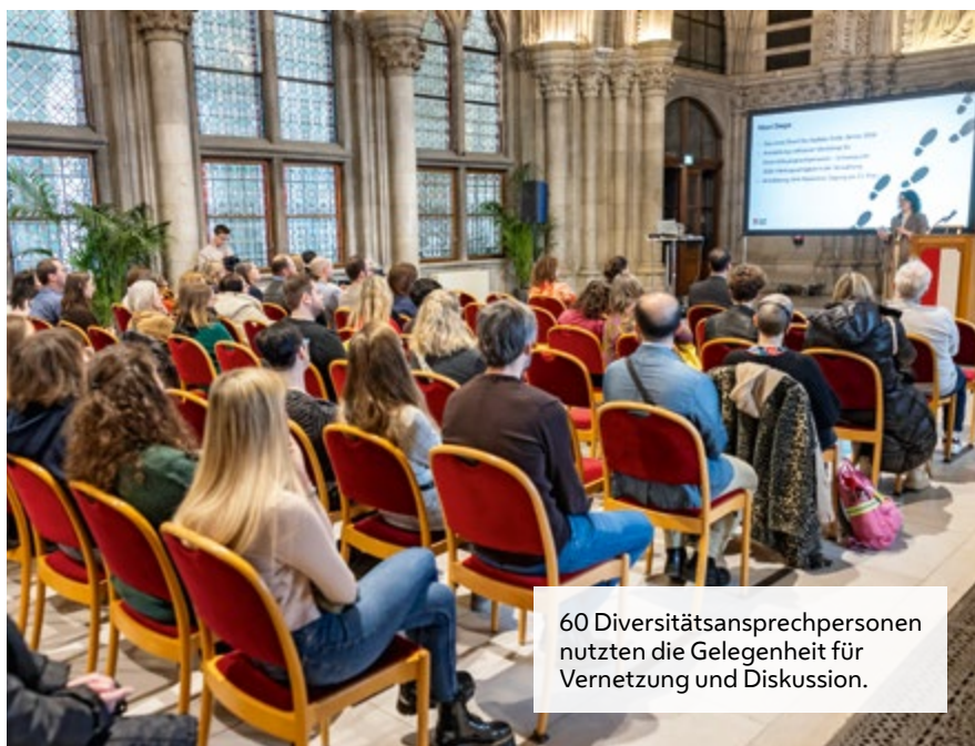
60 Diversitätsansprechpersonen nutzten die Gelegenheit für Vernetzung und Diskussion.

„Wir arbeiten intensiv daran, die Diversitätskompetenz in der Stadtverwaltung weiter auszubauen“, so die Expertin. „Wir sind auf einem guten Weg, aber es gibt noch viel zu tun“, sagt Zahradnik-Stanzel. Darum wurden nun neue Angebote für die Diversitätsansprechpersonen entwickelt: „Es gibt Workshops, einen Newsletter und regelmäßige Netzwerktreffen.“ Mit im Planungsteam ist auch Dorna Saadati. Sie hat das erste Treffen im Rathaus moderiert. „Ich bin in dem