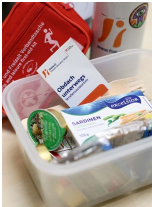
Lebensmittel sind immer im Rucksack des Teams zu finden – von Suppen bis Konserven.

Je nach Zuständigkeit und abhängig davon, ob die obdachlosen Personen schon aktiv betreut werden sowie dem Einsatzort, übernimmt „Obdach unterwegs“ rund 50 Prozent der Meldungen. Zusätzlich begeht das Team 13 Routen routinemäßig und bietet wenn nötig Unterstützung an. Werden Personen im Freien angetroffen, wird behutsam Kontakt aufgenommen. „Wir stellen uns vor, klären die Situa-