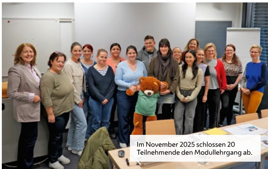
Im November 2025 schlossen 20 Teilnehmende den Modullehrgang ab.

Beide haben zuvor beim Wiener Gesundheitsverbund gearbeitet und sind mit reichlich Erfahrung an die Schulen gekommen. Ein großer Unterschied zur vorhergehenden Tätigkeit ist die Eigenständigkeit. „Wir haben enormen Gestaltungsspielraum und müssen eigenständig Entscheidungen treffen. In den meisten Fällen bin ich die alleinige Ansprechperson“, so Rumpf. „Durch die verschiedenen Altersgruppen, mit