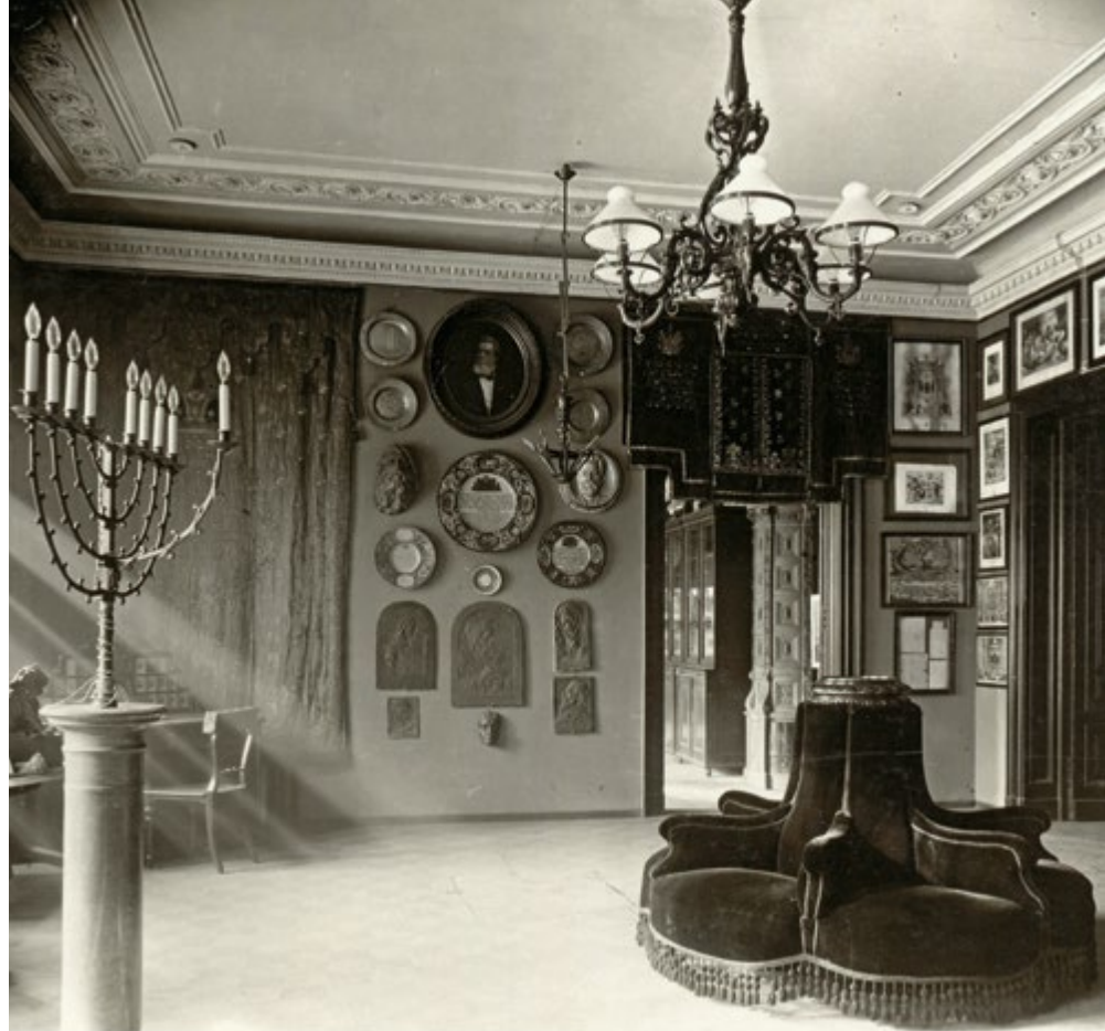
Ausstellungsraum des ersten Jüdischen Museums in der Wiener Malzgasse 16

Der zweite Standort am Judenplatz, mit Ausgrabungen der mittelalterlichen Synagoge, wurde im Jahr 2000