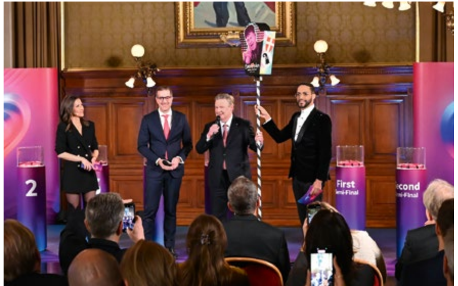
Bürgermeister Michael Ludwig erhielt von seinem Amtskollegen eine Fasnachtslaterne.

J etzt ist es offiziell: Mit der Staffelübergabe durch Basels Bürgermeister Conradin Cramer ist Wien nun Ausrichter des Eurovision Song Contest 2026. Zusätzlich zum ESC-Zepter übergab die Schweizer Delegation Stadtchef Ludwig eine Fasnachtslaterne mit dem Bild von Vorjahressieger JJ, die in der Wiener Stadthalle eine neue Heimat finden soll. Für Ludwig „ein schönes Zeichen der Verbundenheit“. Der Song Contest sei „gerade in Zeiten, in denen es Krisen und Kriege gibt, etwas Wunderbares“, betonte der Bürgermeister. Schließlich zeige das weltgrößte Event dieser Art,