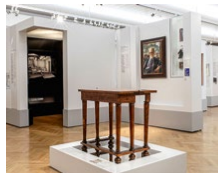
Moderne Interpretation historischer Objekte im Museum Dorotheergasse