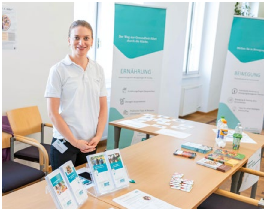
Die Expert*innen des AMZ bieten wertvolle Gesundheitstipps.