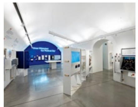
Innovativ ist das Museum Judenplatz dem Mittelalter auf der Spur.