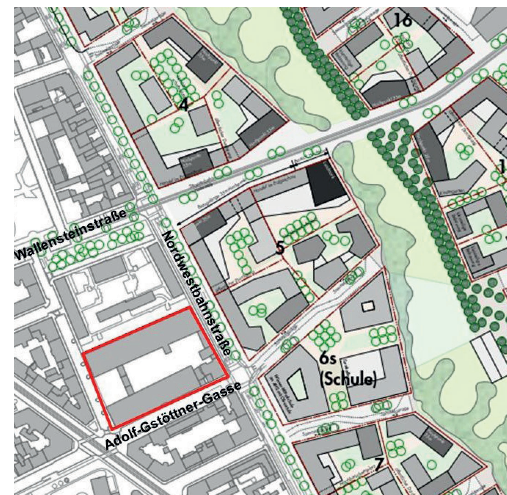
Ausschnitt Leitbild Nordwestbahnhof/mögl. Bebauungsszenario