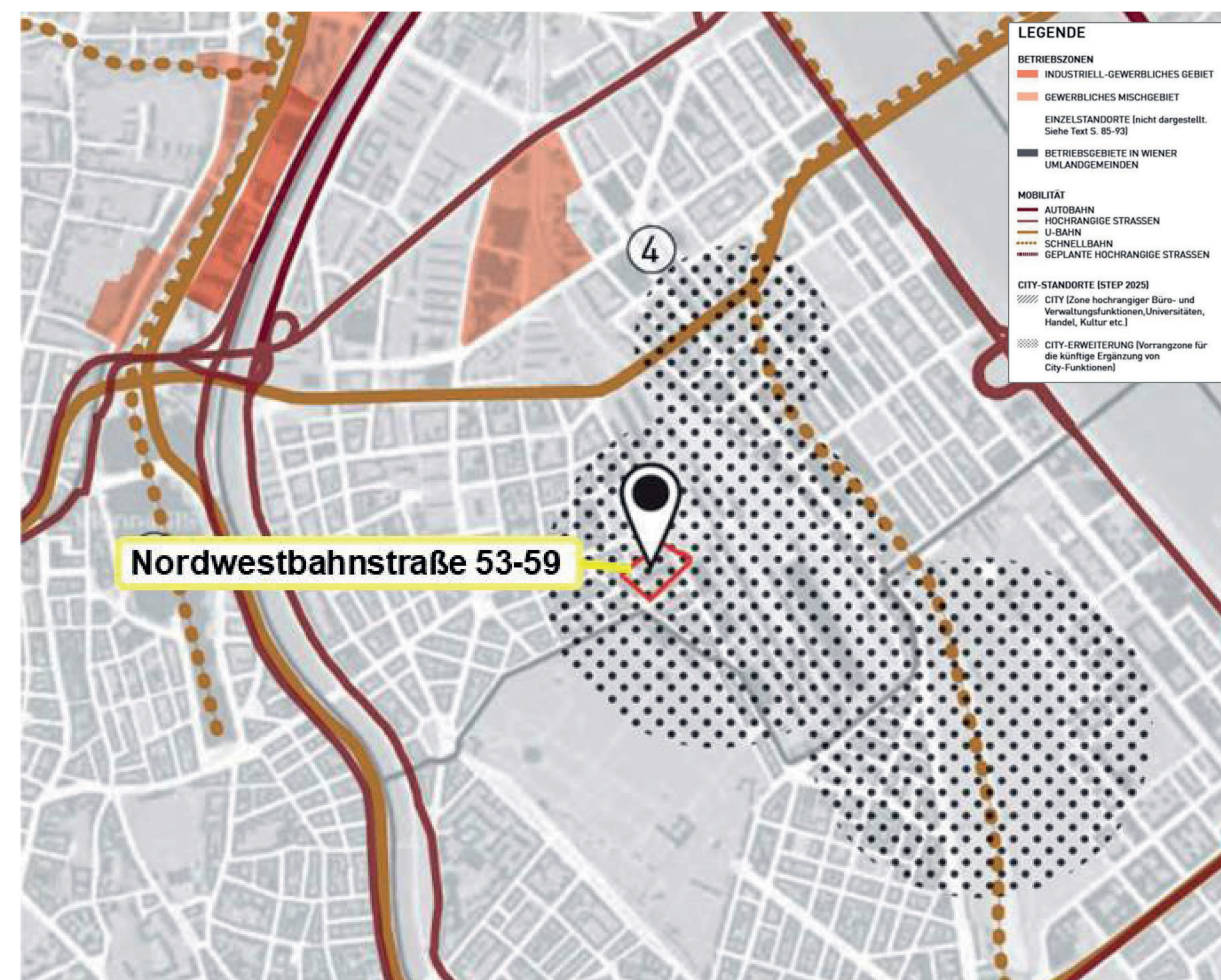
Ausschnitt Betriebszonen in Wien (Fachkonzept Produktive Stadt, STEP 2025)