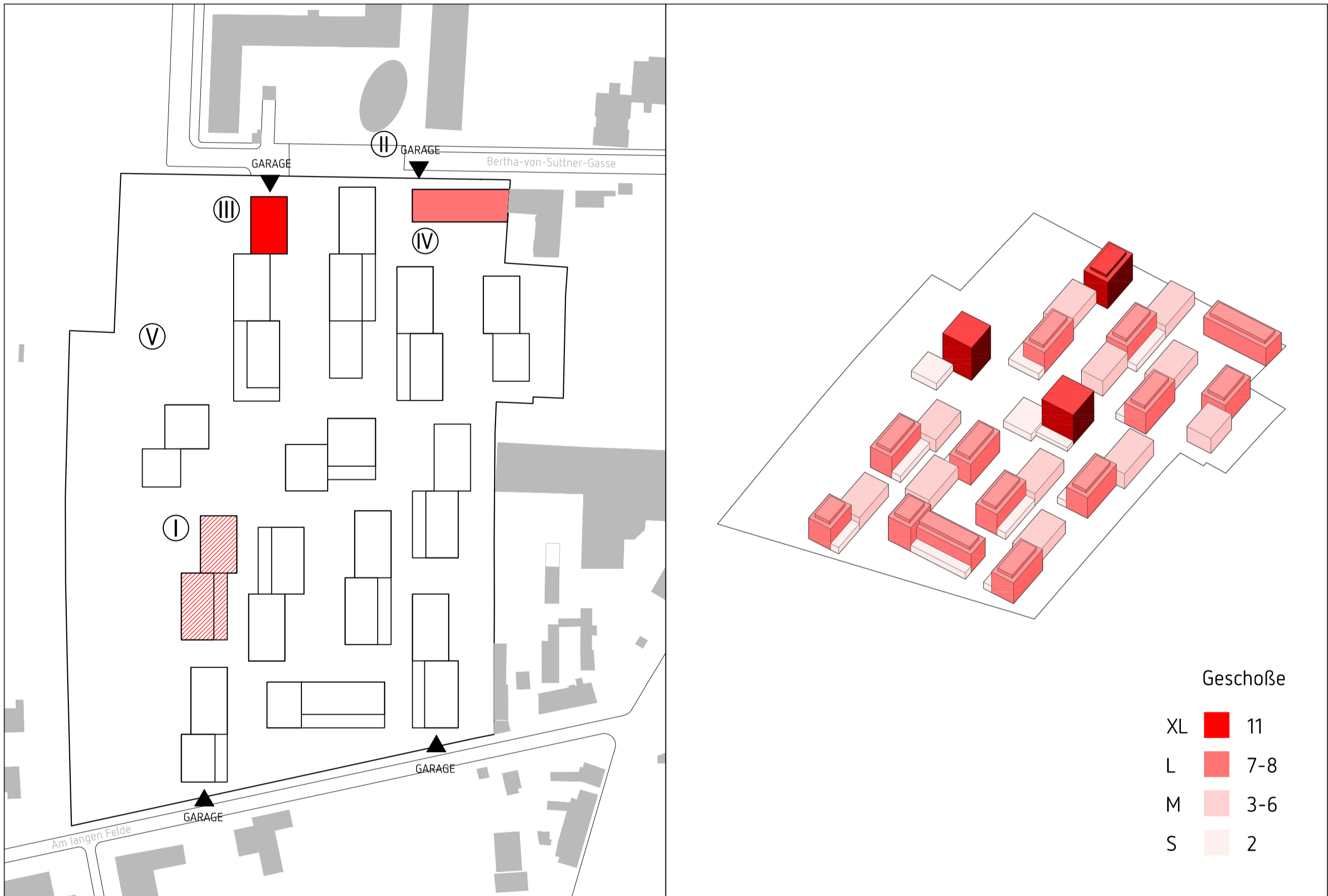
Stand Wettbewerb 02 2017