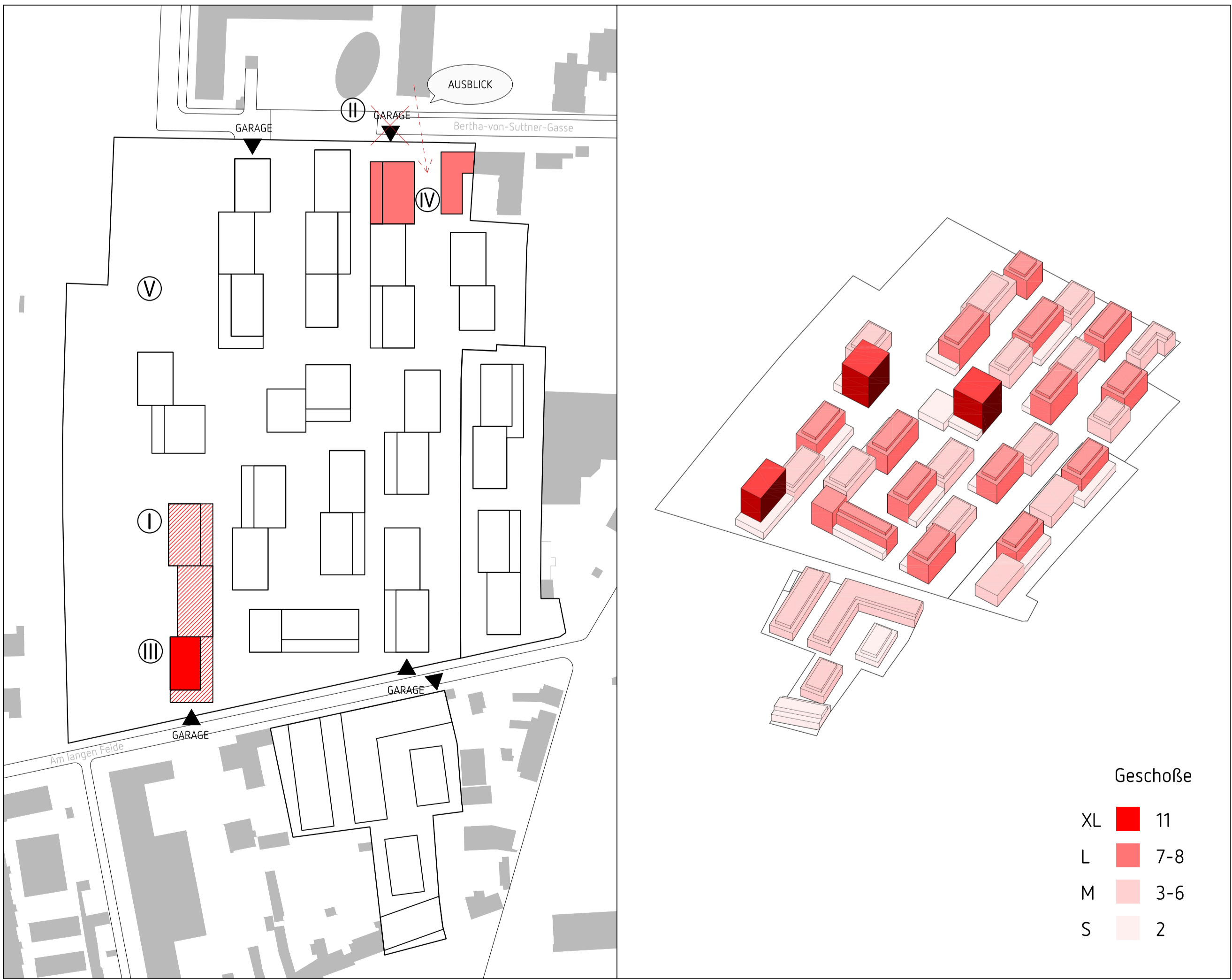
Stand 09 2018 (erweitertes Projektgebiet)