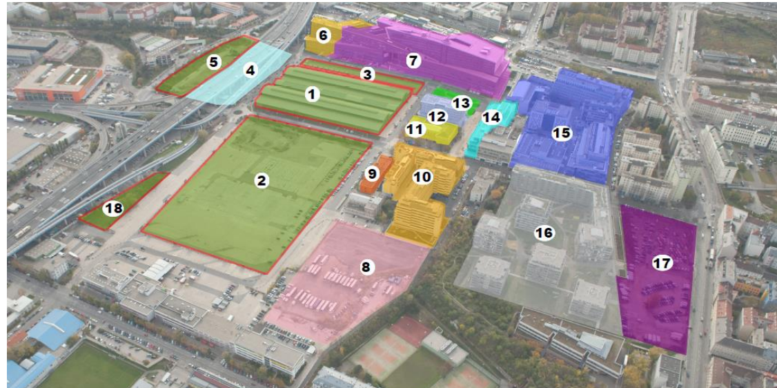
Luftbild 2014 markiert