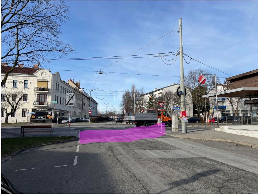
Abbildung 1 Schutzweg (pink)