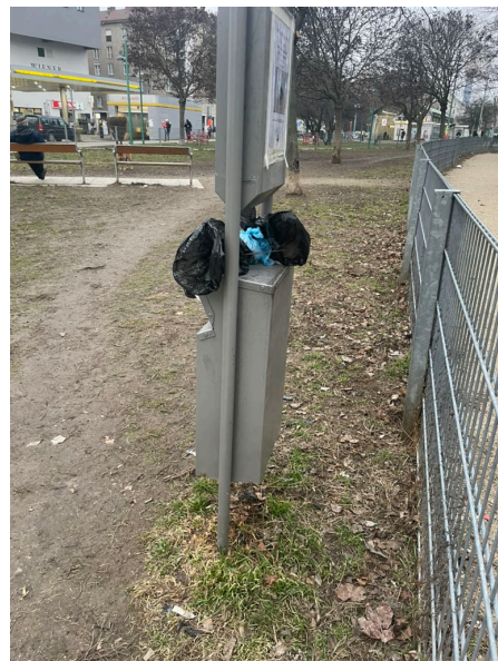
Abbildung 2: Lokalaugenschein Hundezone 10. Februar 2026