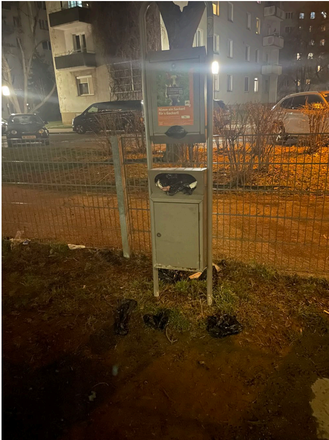
Abbildung 3: Lokalausweis Hundezone 23. Februar 2026