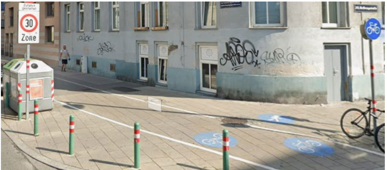
Bild: Altglascontainer vor Universumstraße 21.