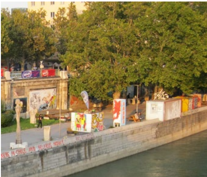
Agora Konzert- und Liegeplattform, Schwedenplatz

Die zuständigen Dienststellen des Magistrats der Stadt Wien werden ersucht, die Errichtung einer Plattform für Musikveranstaltungen am Donaukanal zu prüfen.