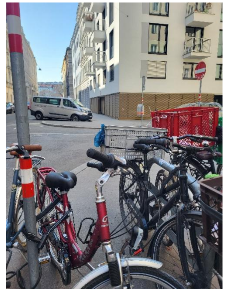
1: Zu sehen ist der überfüllte Radständer sowie der freie Platz auf der gegenüberliegenden Seite

Der vorliegende Fahrradständer ist überlastet und Fahrräder werden an nicht dafür vorgesehene Stellen angeschlossen. Um dieser Nachfrage nachzukommen, soll ein weiterer Fahrradständer auf der gegenüberliegenden Straßenseite Ausgleich schaffen.