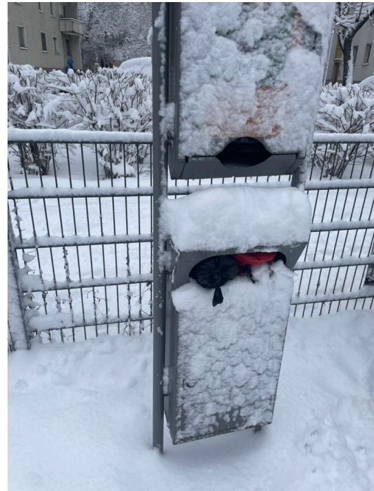
Abbildung 4: Lokalausweis Hundezone 20. Februar 2026