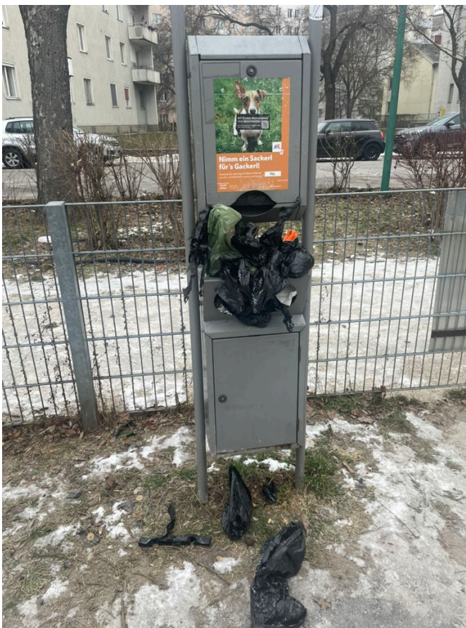
Abbildung 1: Lokalaugenschein Hundezone 22. Jänner 2026

Es ist Aufgabe der Stadt, die notwendigen Rahmenbedingungen zu schaffen, damit Sauberkeit überhaupt möglich ist. Damit Menschen ihren Müll sowie Hundekot ordnungsgemäß entsorgen können, braucht es zwei weitere Mistkübel (mit integriertem Aschenrohr) in der Hundezone. Diese sollten sich idealerweise neben den Sitzbänken befinden, da sich dort die Menschen in der Hundezone hauptsächlich aufhalten. Außerdem wäre das Aufstellen von Hinweisschildern mit der Bitte um ordnungsgemäße Entsorgung hilfreich.