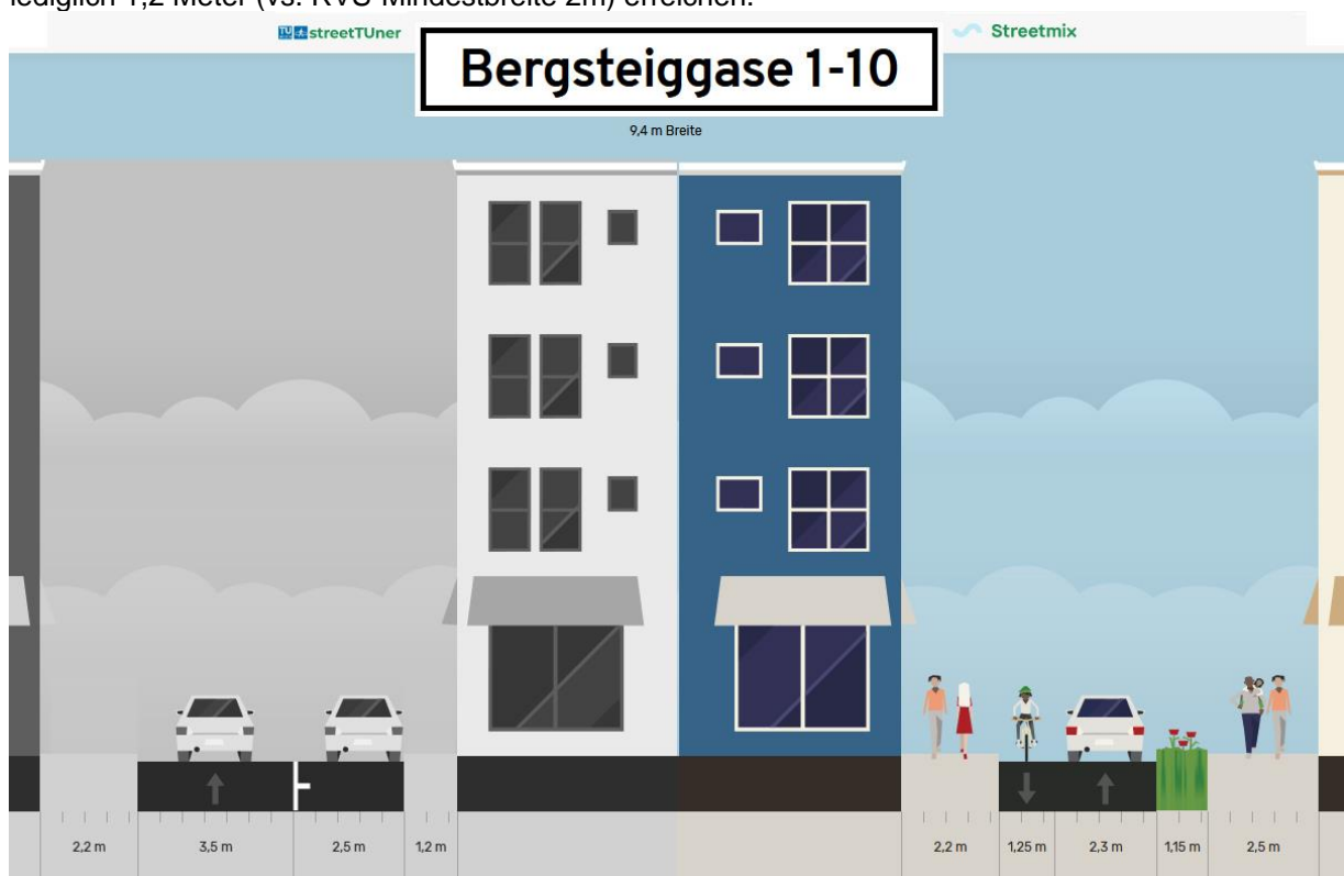
Fig. 2. Links: Der aktuelle, nicht RVS-konforme Straßenquerschnitt. Rechts: Ein möglicher Straßenquerschnitt bei Einhaltung der RVS-Mindestbreiten für Verkehrsanlagen aller Verkehrsteilnehmer_innen.