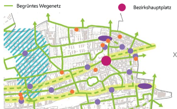
Abbildung 5 Masterplan Penzing 2023