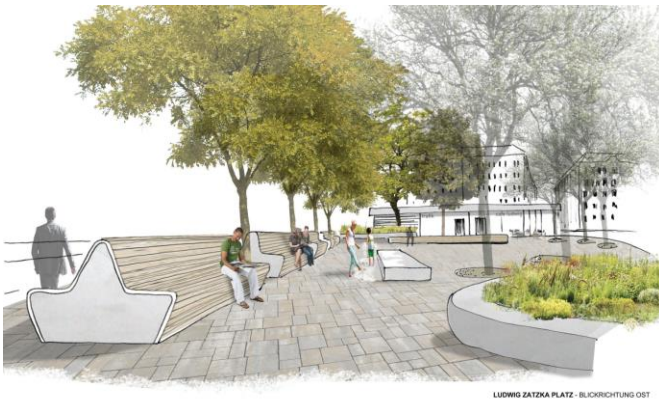
Abbildung 4 Entwurf Hauptplatz 2017