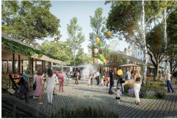
Abbildung 1 Bspl. Klimafitter Hauptplatz mit Markt 2024