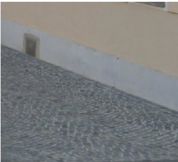
Bestehender Bodenbelag in der Goldschlagstraße