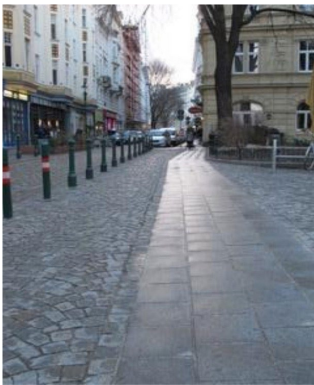
Streifen aus glatten Platten am Servitenplatz