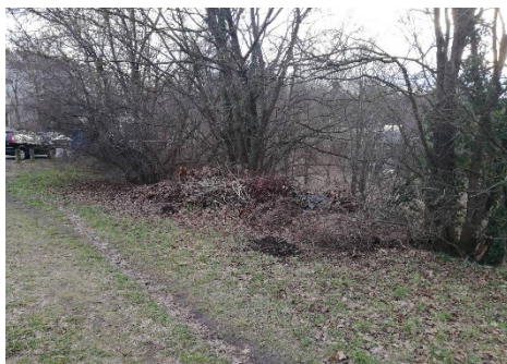
Abbildung 1: „wilde“ Ablagerungen

Durch zusätzliche Kapazitäten kann eine ordnungsgemäße Entsorgung erleichtert, wiederkehrende Ablagerungen reduziert und langfristig Kosten für die Stadt Wien vermieden werden.