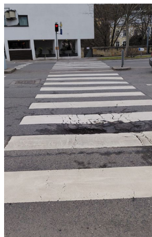
Fahrbahnschäden am Zebrastreifen