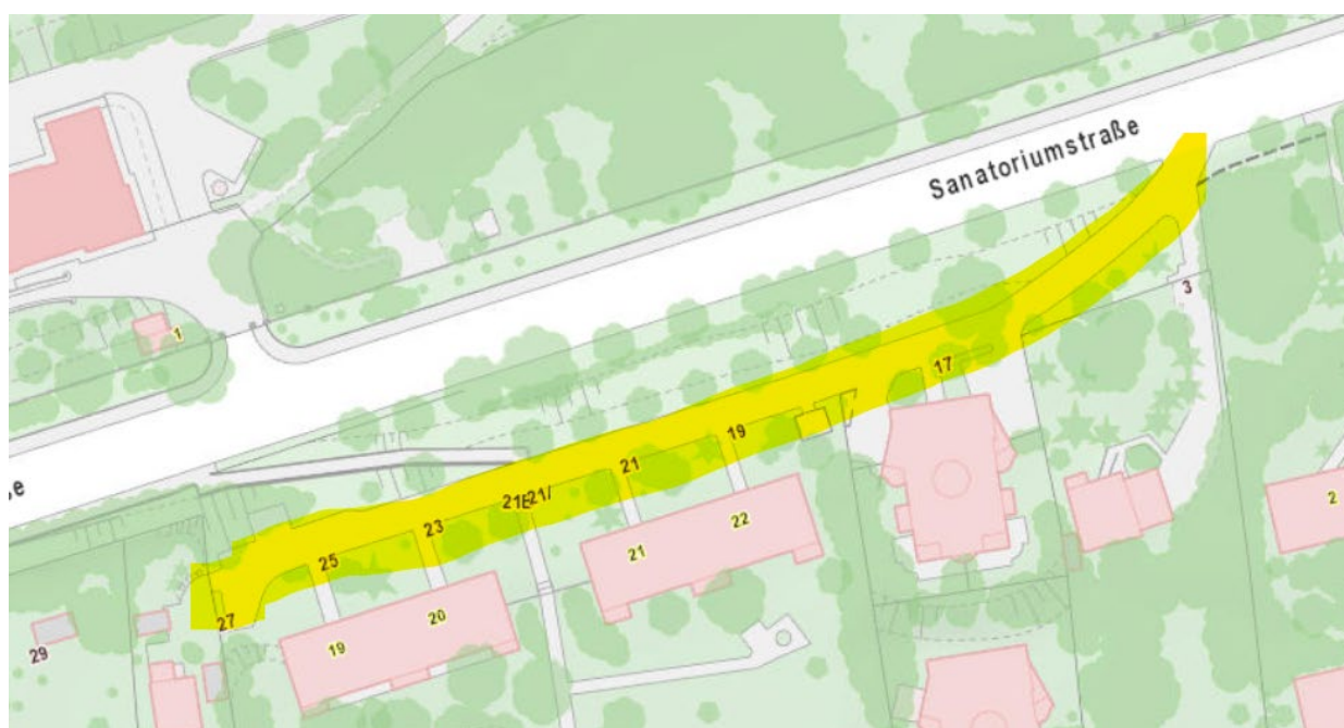
Abbildung 1: sanierungsbedürftiger Abschnitt der Sanatoriumstraße

Der zuständige Stadtrat für Stadtentwicklung, Mobilität und Wiener Stadtwerke, Mag. Ulrike Sima wird ersucht, bei den zuständigen Magistratsabteilungen der Stadt Wien, insbesondere bei der MA 28 (Straßenverwaltung und Straßenbau), die umgehende Prüfung sowie die ehestmögliche komplette Sanierung der Sanatoriumstraße im Bereich Höhe 03-27, insbesondere vor den dortigen Gemeindebauten (siehe markierten Planausschnitt), zu veranlassen und über die gesetzten Maßnahmen sowie einen allfälligen Zeitplan schriftlich zu berichten.