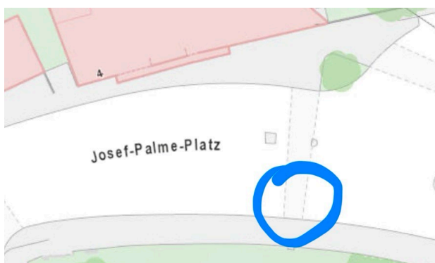
Standort Josef Palme Platz