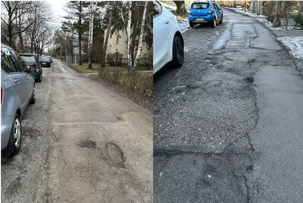
Abbildung 2 & 2: Strassenschäden Sanatoriumstrasse vor Gemeindebauten

Bloße punktuelle oder notfallmäßige Ausbesserungen einzelner Schadstellen sind nicht ausreichend, da sie die strukturellen Mängel des gesamten Straßenabschnitts nicht nachhaltig beheben. Erforderlich sind daher eine umfassende Prüfung und fachgerechte Sanierung des betroffenen Bereichs.