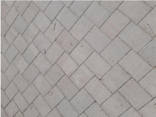
Bodenbelag im Ludwig-Zatzka-Park