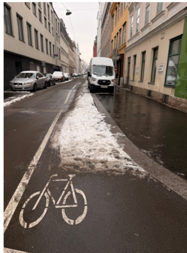
Columbusgasse am 10. Jänner 2026