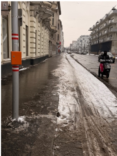
Landgutgasse am 10. Jänner 2026

Diesen Winter ist eine eklatante Verschlechterung der Räumungssituation auf Favoritner Straßen zu bemerken. Auch Tage nach Schneefällen sind vor allem Radwege nicht geräumt.