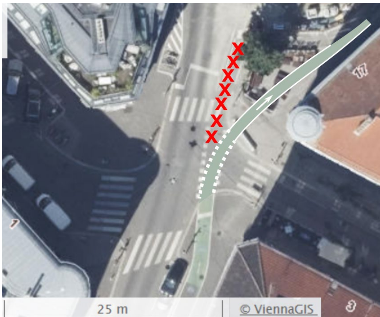
Abbildung 1: Basisvariante: Verlegung des Radwegs in einer Richtung im Bereich des ehemaligen Schanigartens.