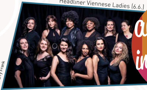
Headliner Viennese Ladies (6.6.)