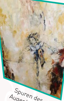
Spuren des Augenblicks (27.5.)

Bezirksvorsteherung Festsaal, 6., Amerlingstraße 11, 1. Stock