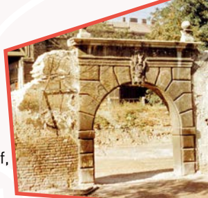
Von der Gumpendorfer Linie zum Gürtel (2.6.)

Treffpunkt: Fritz-Imhoff-Park, 6., Mollardgasse