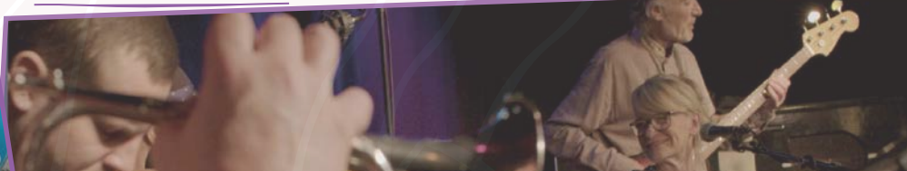
BALKAN-WALTZ mit UNGERADEN (5.6.)