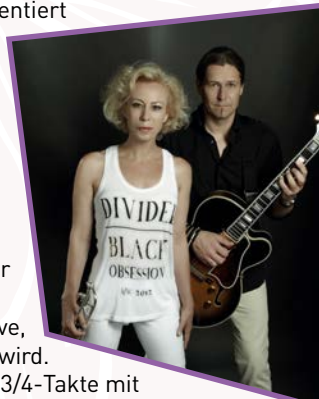
MARIAHILFER JAZZ & GENUSSTAG (3.6.)

Bei Schlechtwetter: Ersatztermin: Mittwoch, 17.6. Marktraum-Terrassendach, 6., Naschmarkt