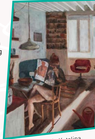
Nataša Katalina (27.5.)

ega: frauen im zentrum, 6., Windmühlgasse 26