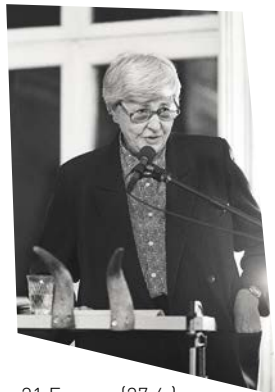
Johanna Dohnal im Porträt von 21 Frauen [27.6.]