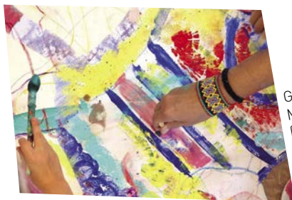
Gemeinsam in Mariahilf: Malaktion für Erwachsene (2.6.)