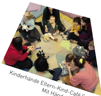
Kinderhände Eltern-Kind-Café Spezial! Mit Händen singen (3.6.)