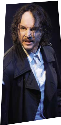
Heinrich 5 (7.6.)

Bezirksmuseum Mariahilf, 6., Mollardgasse 8 (Mezzanin)