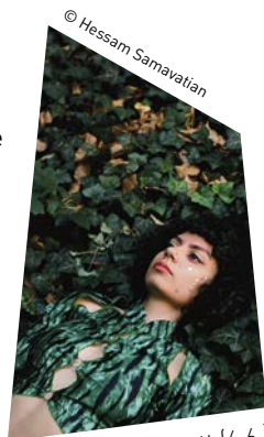
© Hessam Samavatian 20 Jahre Jazzwerkstatt (6.6.)