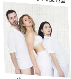
KÖRPER [SIC!] (28.5.)

„Körper [sic!]“ ist eine Stückentwicklung von Ars ex Machina, einem Theaterkollektiv, das die Bedeutung des menschlichen Körpers in unserer Gesellschaft auslotet. Wie steht es um die Beziehung zu Ihrem Körper? Lassen Sie sich durch den Fleischwolf jagen und werden Sie sich selber wurst.