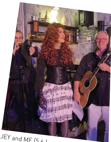
JEY and ME (5.6.)