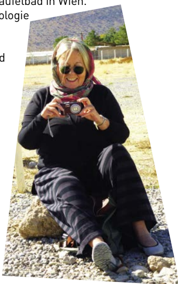
Sonnige Grüße aus dem Jenseites [4.6.]