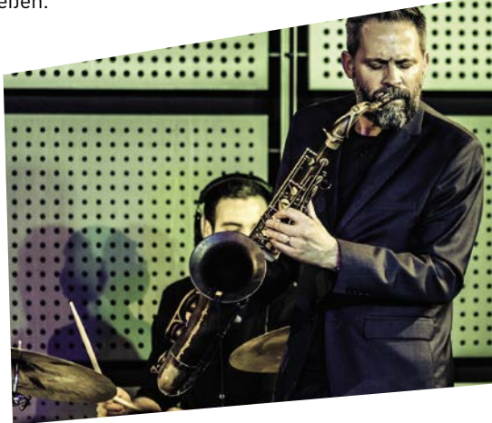
AZURE ist da!!! (4.6.)