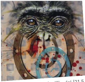
Bestiarium im Wandel (21.5.)