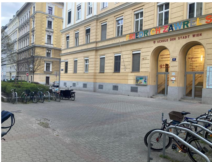
Hörnesgasse 12, 1030 Wien

Best-Practice Beispiele: Die Stadt Wien hat schon einige autofreie Schulvorplätze umgesetzt. Und die Erfahrung zeigt, dass die neugewonnenen Aufenthaltsflächen gut genutzt werden. Denn auch Anrainer:innen finden hier neuen Erholungsraum und der sozialer Austausch wird gestärkt.