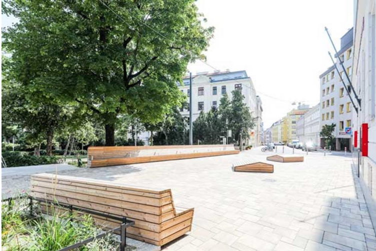
Schulgasse 57, 1180 Wien