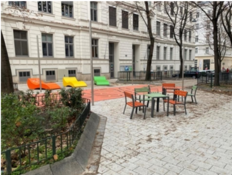
Kleistgasse 12, 1030 Wien

Mehr als 500 Unterschriften, u.a. auch von Anrainer:innen, Eltern und Lehrer:innen zeigen, wie groß der Wunsch nach einem autofreien Schulvorplatz vor der NMS Hainburgerstraße ist.