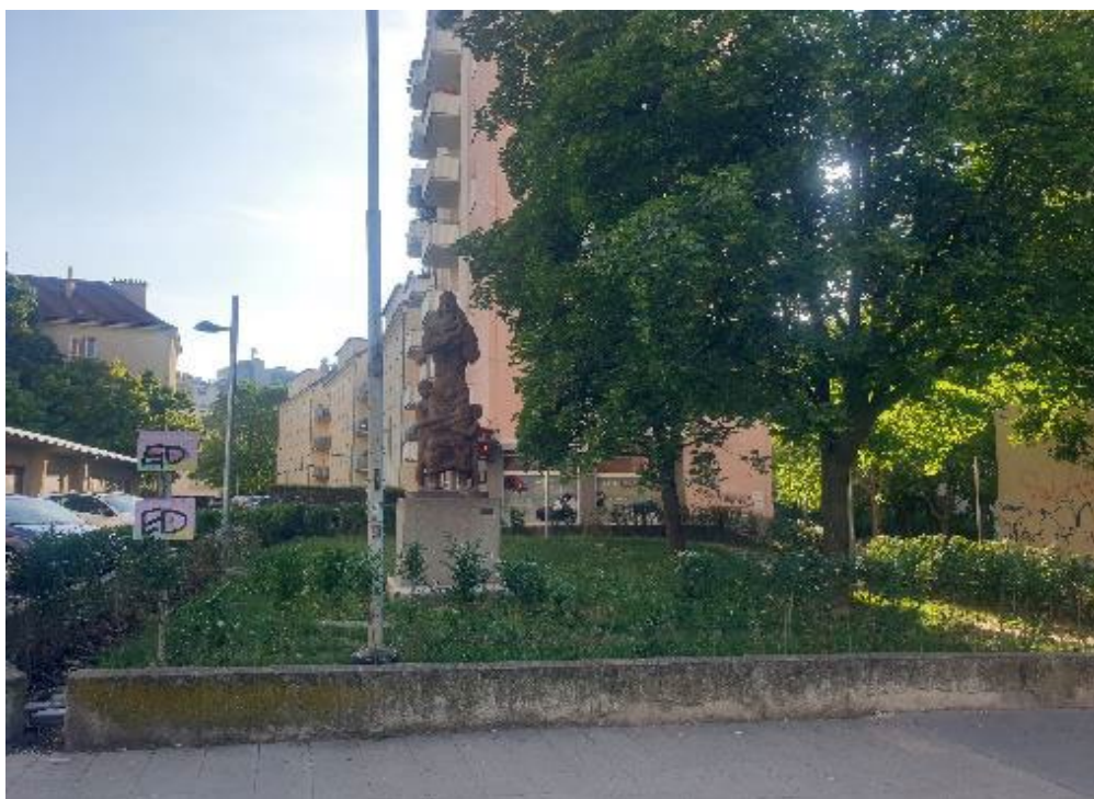
© Foto von Anna László, aufgenommen auf der Wieden im Juni 2025: Straßenseitiges Abstandsgrün im Bertha von Sutter-Hof