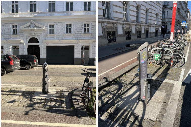
Wien, am 20.03.2025