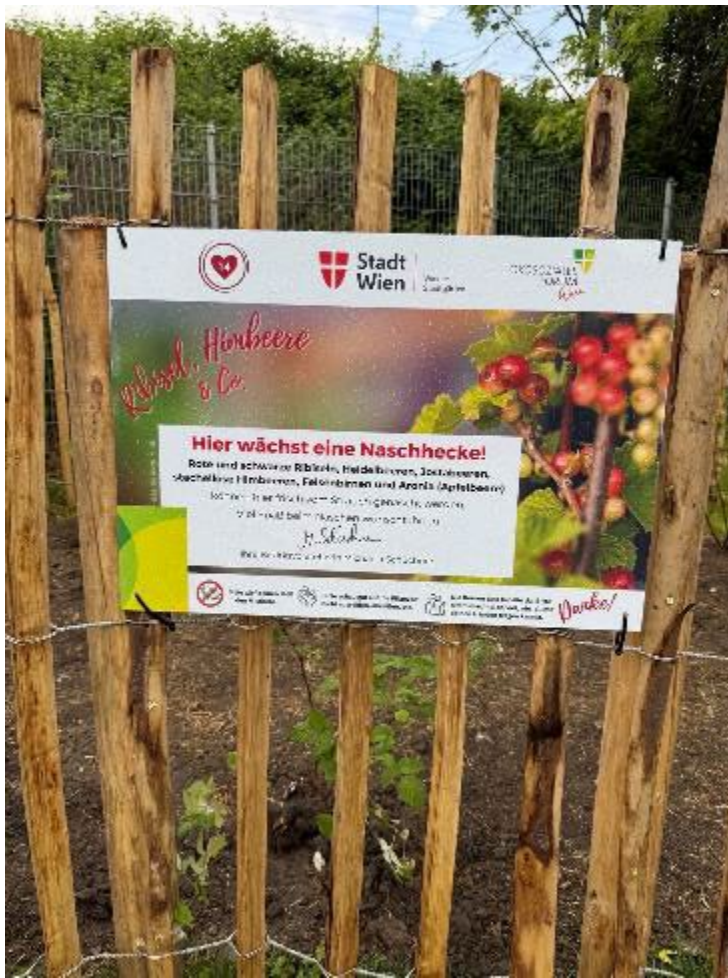
© Foto von Amela Pokorski, aufgenommen in Penzing im Juni 2025: Naschhecke in Penzing