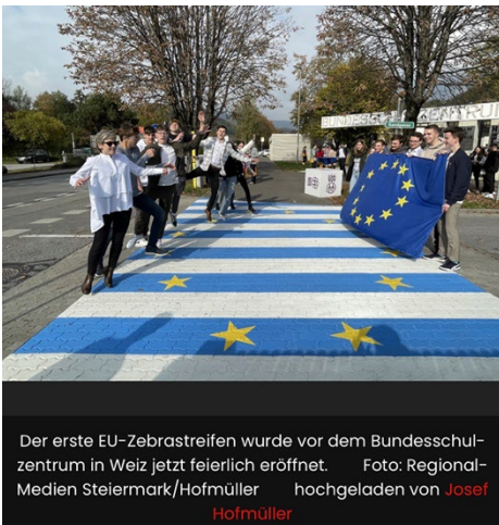
Beispiel aus Weiz