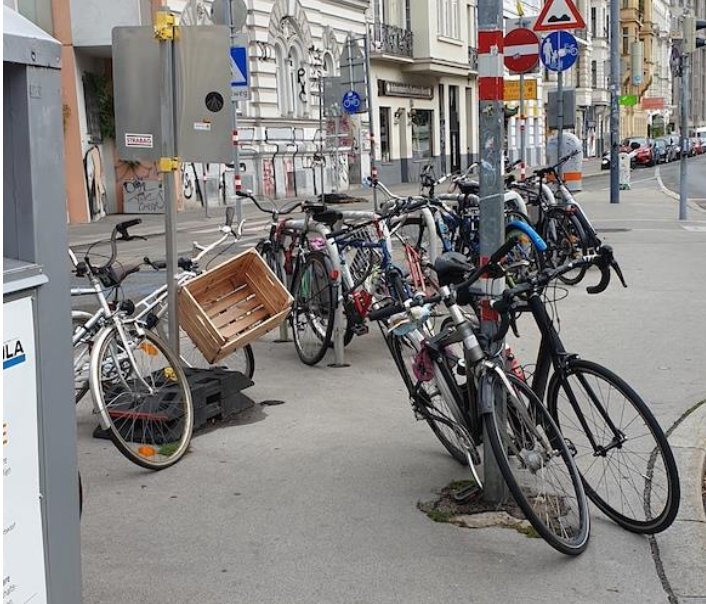
Ansicht nach Osten