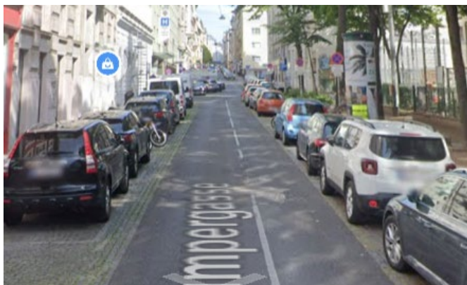
Stumpergasse zw. Gumpendorfer Straße & Liniengasse