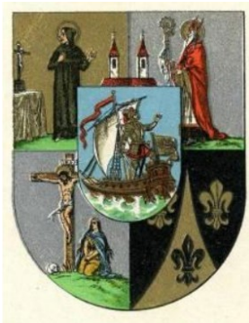
Beispiel für Abbildung: Bezirkswappen Mariahilf