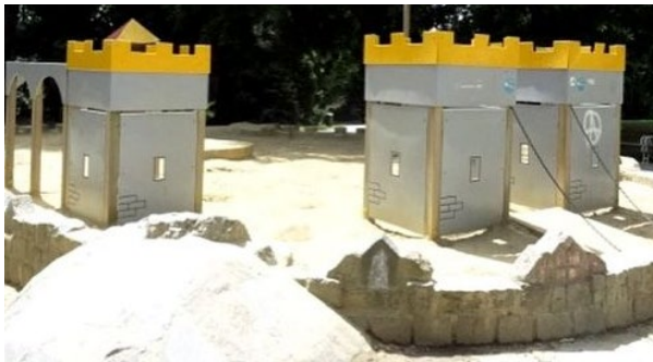
Foto: Sandkiste in der prallen Sonne

Weiters sind auch Wasserspender weit entfernt. Auch Tischtennisspieler:innen wollen ihren Durst löschen, leider werden deren verwendete Glasflaschen nicht immer fachgerecht entsorgt, sondern einfach stehen gelassen. Ein Trinkbrunnen könnte hier Abhilfe leisten und wäre für alle – Groß und Klein - sehr willkommen.