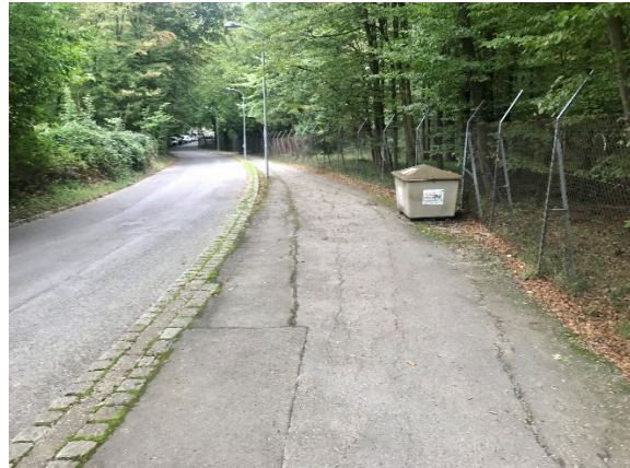
Foto 6: Streugut-Kasten am breiten Gehsteig, die ehem. vorhandene Bank fehlt