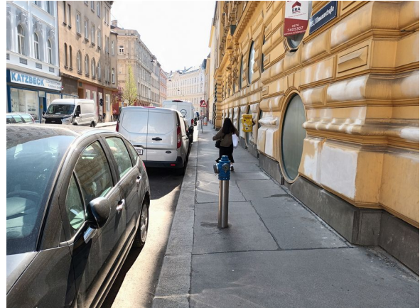
Abb. 2 & 3: Sparkassaplatz: Hydrant 1 und Hydrant 2