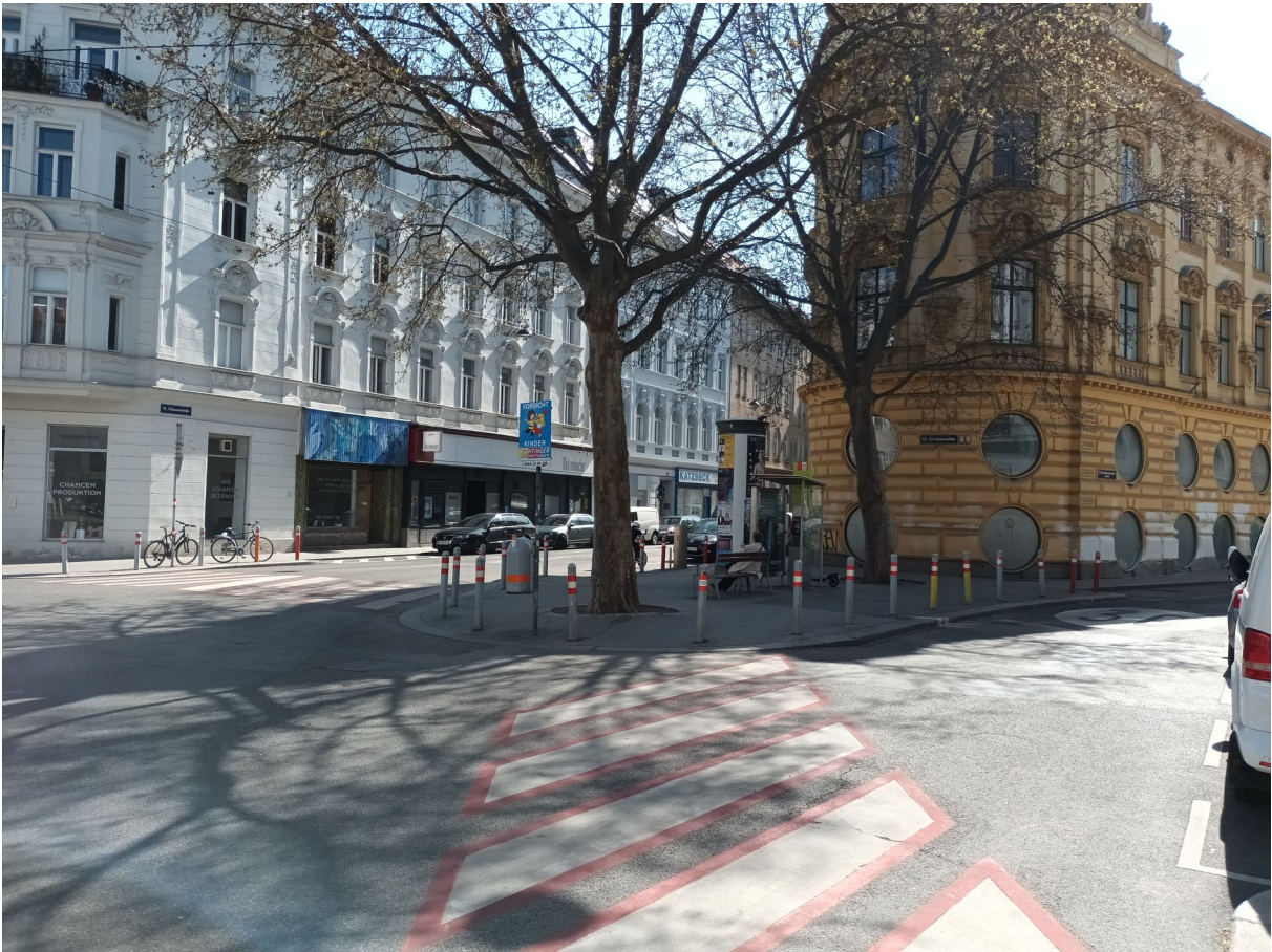
Abb. 1: Sparkassaplatz ON4: möglicher Aufstellungsort Trinkbrunnen