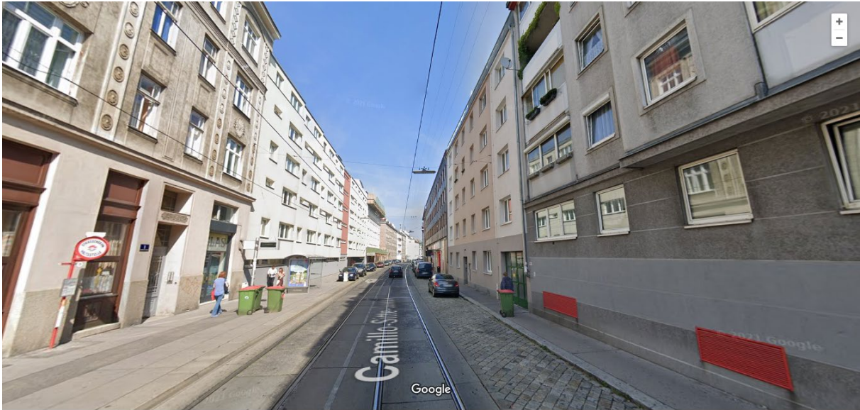
Abb. 2: Camillo-Sitte-Gasse ON 2 bis ON 10 auf der rechten Seite; Blickrichtung nach Norden