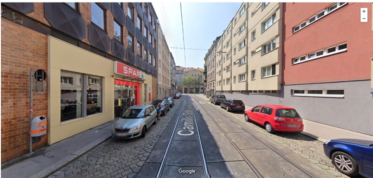
Abb. 3: Camillo-Sitte-Gasse ON 2 und ON 10 auf der linken Seite; Blickrichtung nach Süden