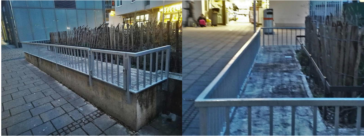
[Meiselstraße 5 (linkesBild) und 8 (rechtes Bild)]