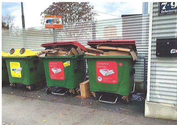
Überfüllte Sammelbehältnisse Zehetnergasse