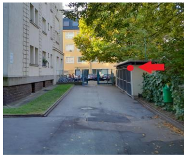
Müllinsel im Hof