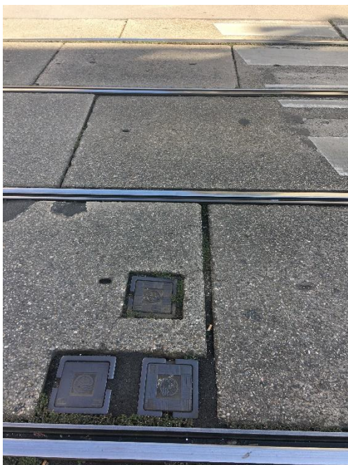
Abbildung 1: Fugen quer zur Fahrbahn bergen massive Unfallgefahr (Hier: # Kirchstetterng.)