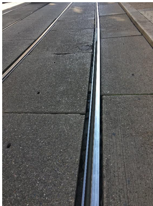
Abbildung 2: Auch längs der Fahrbahn finden sich teilweise zentimeterbreite Fugen.