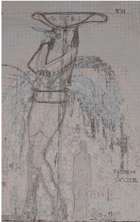
Systemskizze Parksheriff Schönbrunnerstrasse