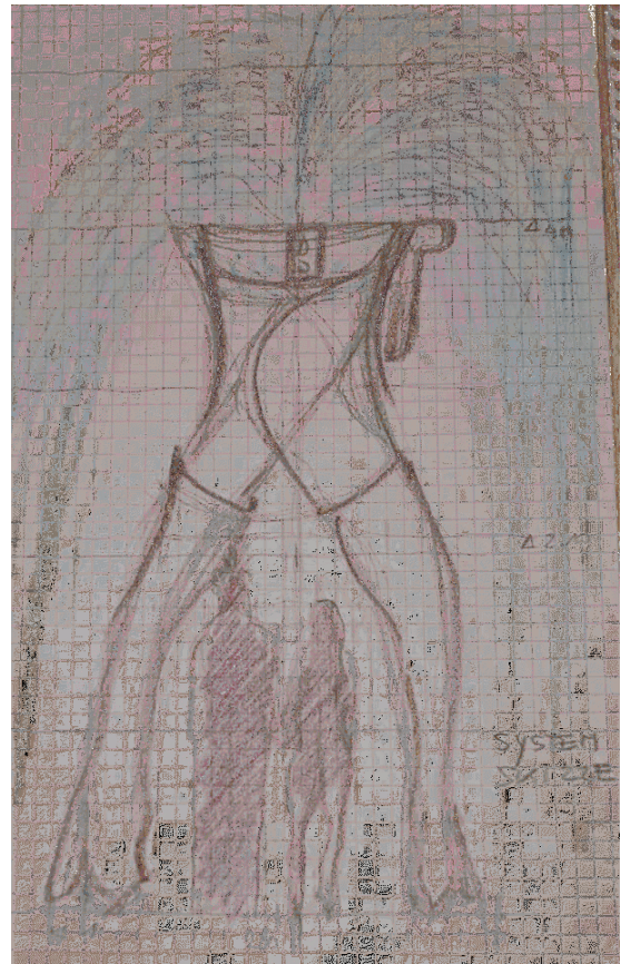
Systemskizze X Stiefel Arbeitergasse