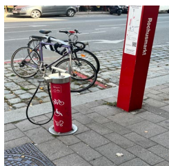
(Bsp. Landstraßer Hauptstraße 48, betrieben durch MA28)

Die zuständigen Stellen der Stadt Wien werden ersucht, eine verankerte Luftpumpe, ggf. auch eine Fahrradservicestation im Bereich der Liesingbachbrücke zu installieren.