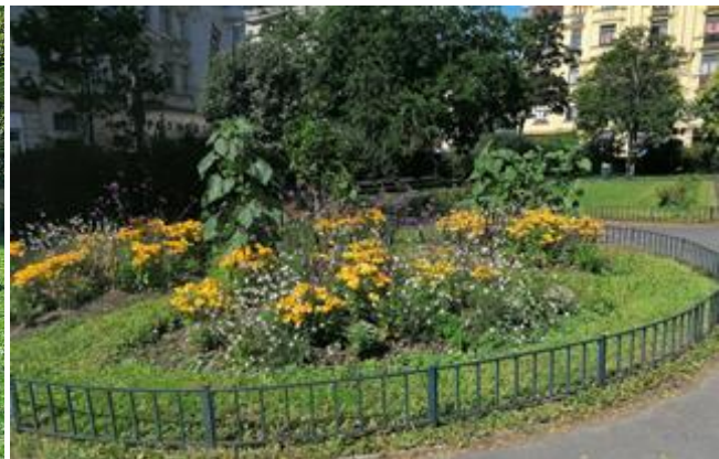
Bepflanzungsbeispiel 1180, Aumannplatz