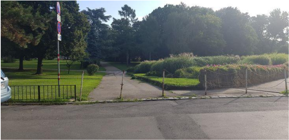
Vorschlag zusätzliche Radwegeinmündung in Donaupark durch Entfernung der Ketten zwischen zwei Stangen