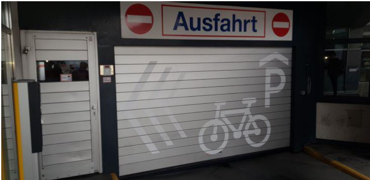
1 Bike and Ride Anlage Eingang