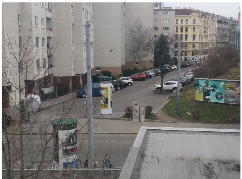
Ende der Durchlaufstraße gegenüber des Eingangs zur S-Bahn Station Traisengasse

Mit überdachten Radabstellplätzen könnte ein Anreiz für den Umstieg auf Fahrrad & S-Bahn bei schlechtem Wetter geschaffen werden. Auch im Projektierungshandbuch der Stadt Wien (Kapitel 3, Blatt 11-12) wird die Bedeutung „qualitativ hochwertiger Stellplätze“ für den Zubringerverkehr zu anderen Verkehrsmitteln wie der S-Bahn hervorgehoben. „Eine Steigerung der Qualität kann derzeit nur durch eine ausreichende Überdachung als Witterungsschutz erzielt werden.“