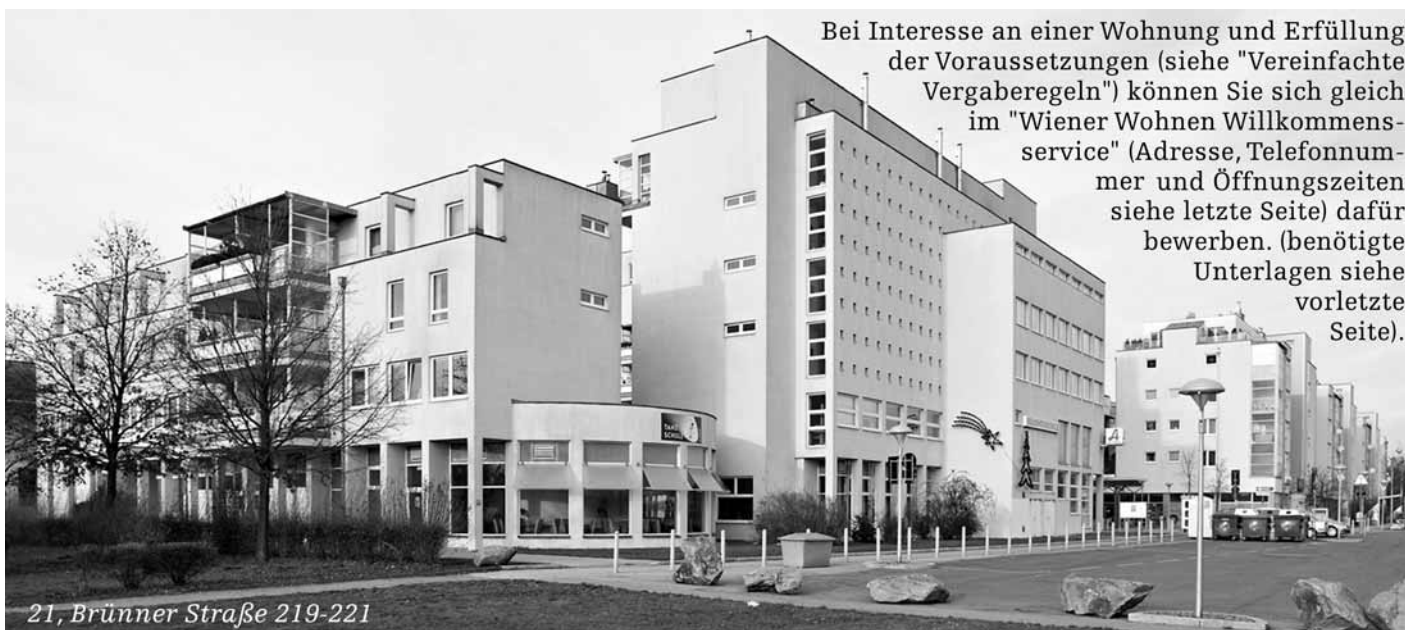
21, Brünner Straße 219-221

Bei Interesse an einer Wohnung und Erfüllung der Voraussetzungen (siehe "Vereinfachte Vergaberegeln") können Sie sich gleich im "Wiener Wohnen Willkommensservice" (Adresse, Telefonnummer und Öffnungszeiten siehe letzte Seite) dafür bewerben. (benötigte Unterlagen siehe vorletzte Seite).