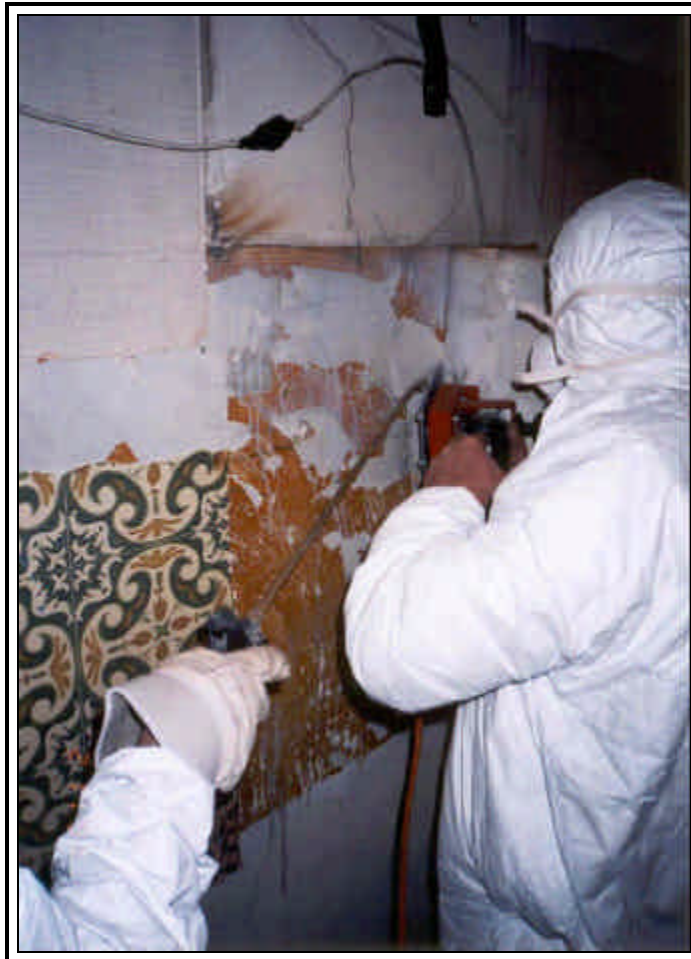
Bild 9: Entfernung des CV-Belages an der Wand bei gleichzeitigem Nässen