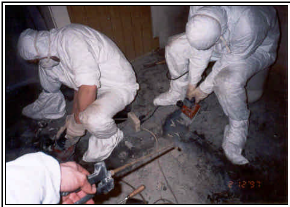
Bild 8: Entfernung der Pappe und der Kleberreste bei gleichzeitigem Nässen