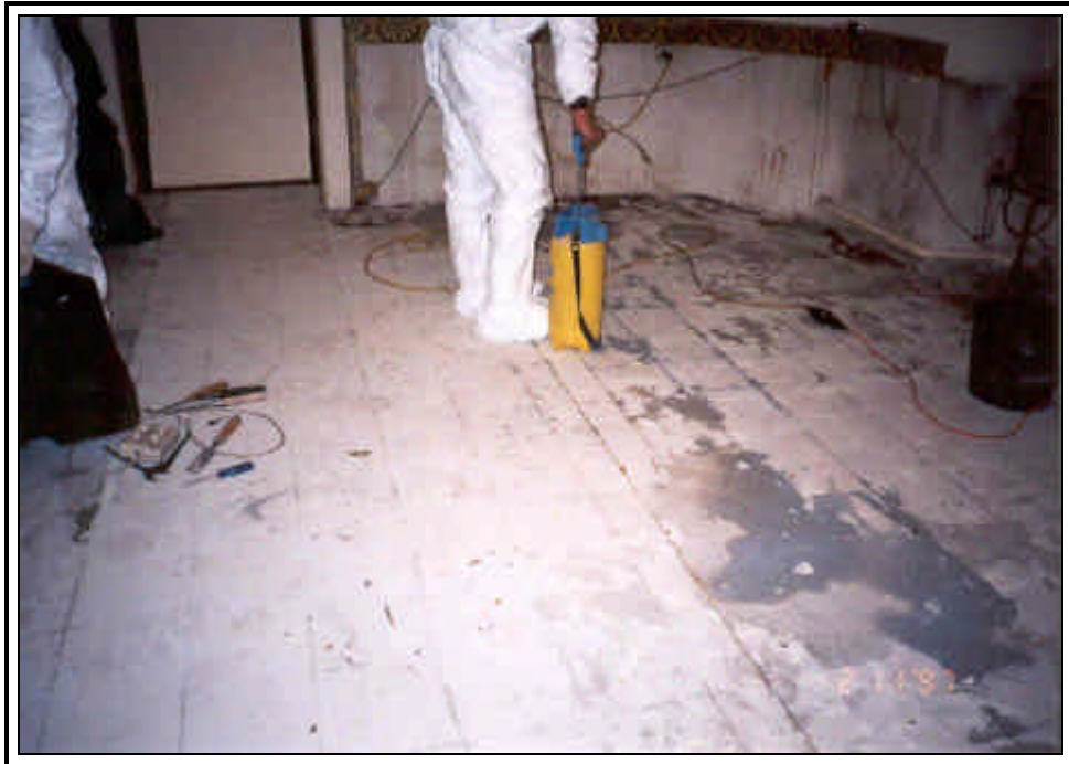
Bild 7: Nässen des Gelierstriches und der Asbestpappe vor weiterer Behandlung