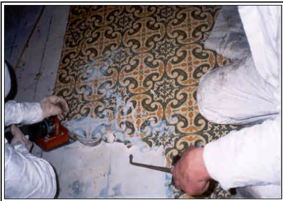
Bild 6: Stückweises Entfernen der Deckschicht bei gleichzeitigem Nässen