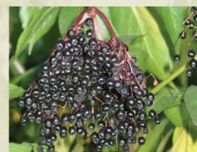
Schwarzer Holler Sambucus nigra ↑ 2-7 (15) m, ☀ V weiß, 🍒 ☹️, 🐝, 🐦