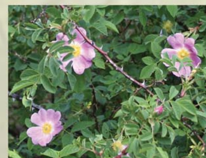
Hundsrose Rosa canina ↑ 1-3 m, ☀ VI-VIII rosa, 🍒 ☹️, 🐝, 🐦