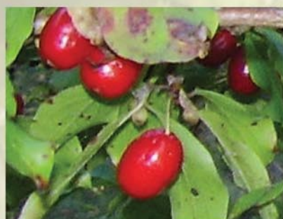
Dirndlstrauch, Kornelkirsche Cornus mas ↑ 3(-8) m, ☀ III gelb, 🍒 ☹️, 🐝, 🐦