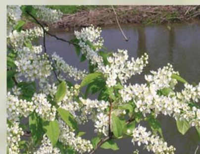
Gewöhnliche Traubkirsche Prunus padus ↑ 2-3(10)m, ☀ V weiß, 🍒 ☹️, 🐝, 🐦