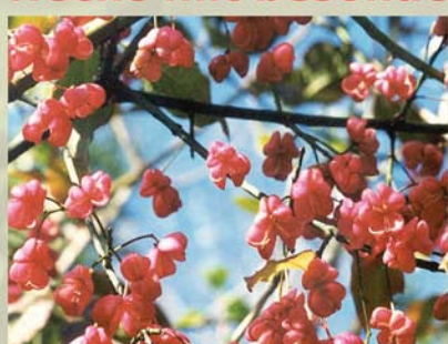
Pfaffenkaperl, Spindelstrauch Euonymus europaea ↑ 1,5 (-4) m, ☀ V gelb-grün, schöne 🍒 ††! 🐝, 🐦 schöne Herbstfärbung