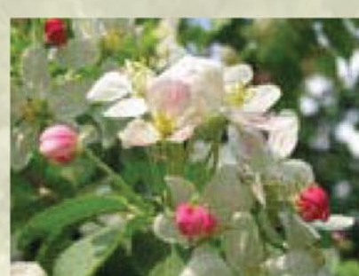
Holzapfel Malus sylvestris ↑ 3(-10) m, ☀ IV-V rosa-weiß, 🍒 ☹️, 🐝, 🐦