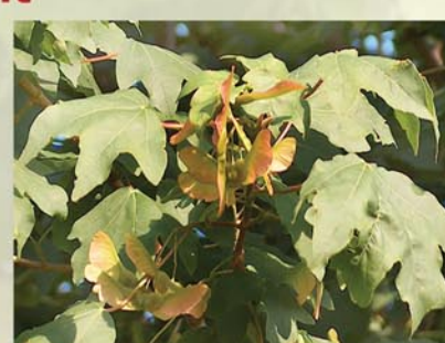
Feldahorn Acer campestre ↑ 2(-8) m, ☀ IV-V gelb, 🐝, 🐦