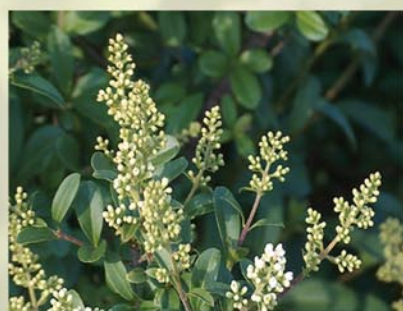
Liguster, Rainweide Ligustrum vulgare ↑ 2-5m, wintergrün, ☀ VI-VII weiß, 🍒 †, 🐝