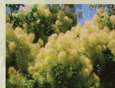
Perückenstrauch Cotinus coggygria ↑ 3-5 m, ☀ V-VI gelb, schöne Frucht, rötliche Herbstfärbung