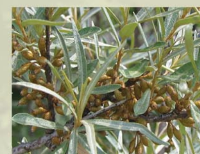
Sanddorn Hippophae rhamnoides ↑ 1-5 m, ☀ IV gelb, 🍒 ☹️, 🐝, 🐦 graues Laub, orange Früchte, 2-häusig

↑ Wuchshöhe ☀ Blütezeit | - XII Monate 🍒 Früchte ☹️ essbar 🐝 Bienenweide 🐦 Vogelfeindlich