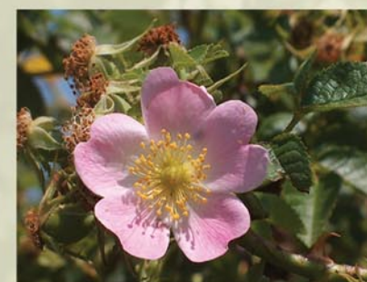
Weinrose, Apfelrose Rosa rubiginosa ↑ 1-2m, ☀ VI-VII rosa, 🍒 ☹️, 🐝, 🐦