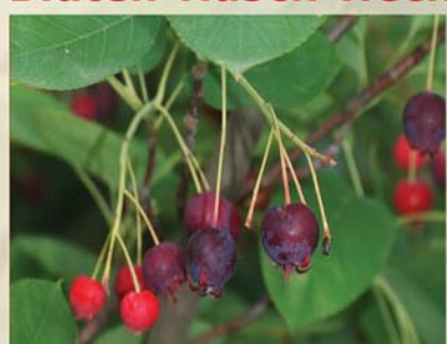
Felsenbirne Amelanchier ovalis ↑ 2-3m, ☀ IV-V weiß, 🍒 ☹️, 🐝, 🐦