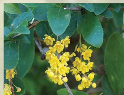
Gewöhnliche Berberitze Berberis vulgaris ↑ 1-3m, ☀ V gelb, 🍒 ☹️, 🐝, 🐦