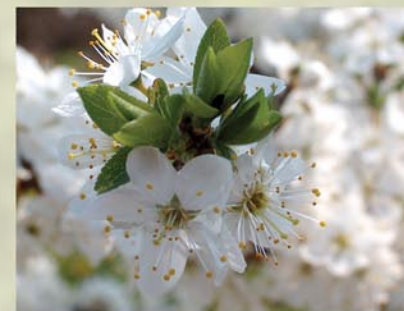
Schlehndorn, Schwarzdorn Prunus spinosa ↑ 1-3m, ☀ IV weiß, 🍒 ☹️, 🐝, 🐦