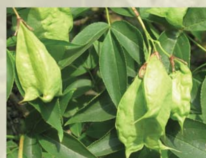
Pimpernuss Staphylea pinnata ↑ 2-5 m, ☀ V-VI weiß, schöne Blüte, blasenartige Früchte, 🐝