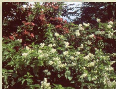
Pfeifenstrauch, Falscher Jasmin Philadelphus europaeus ↑ 1,5-3m, ☀ V-VI weiß, duftend 🐝