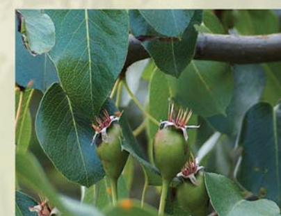
Holzbirne Pyrus pyraster ↑ 3-(15) m, ☀ IV-V weiß, 🍒 ☹️, 🐝, 🐦