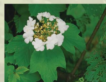
Gewöhnlicher Schneeball Viburnum opulus ↑ 2 (-4) m, ☀ V weiß, 🍒 leicht †, 🐝, 🐦 schöne Blüte, rötliches Herbstlaub, leuchtend rote Früchte