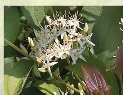
Roter Hartriegel Cornus sanguinea ↑ 2-5 m, ☀ V-VI weiß, 🍒 †, 🐝, 🐦