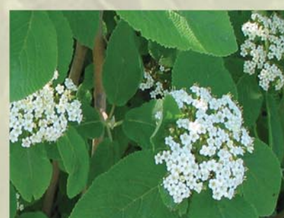
Wolliger Schneeball Viburnum lantana ↑ 2-5 m, ☀ V weiß, 🍒 leicht †, 🐝, 🐦 schöne Blüte, Herbstfärbung, rote und schwarze Früchte