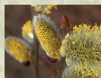
Salweide, Palmkätzchen Salix caprea ↑ 2(-10) m, ☀ III-IV gelb, 🐝, 🐦