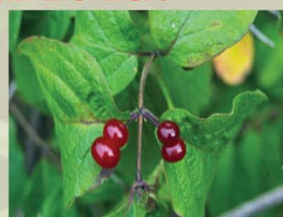
Rote Heckenkirsche Lonicera xylosteum ↑ 1 - 2,5 m, ☀ V gelb-weiß-duftend, 🍒 †, 🐝, 🐦