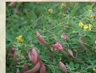
Gewöhnlicher Blasenstrauch Colutea arborescens ↑ 2-3m, ☀ V-VII gelb, 🍒 †, 🐝