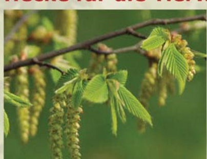
Hainbuche Carpinus betulus ↑ 1(-10) m, ☀ V gelbgrün, 🐝, 🐦