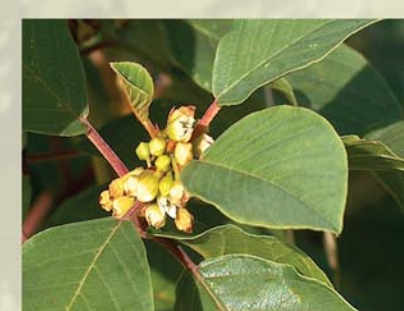
Faulbaum Frangula alnus ↑ 1,5 - 3m (-7) m, ☀ V-VIII weiß, 🍒 †, 🐝, 🐦