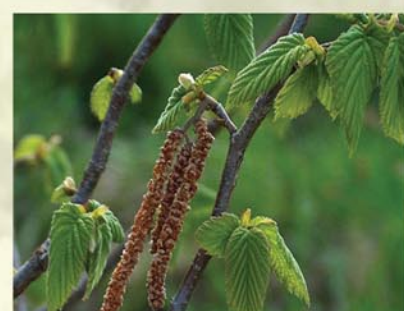
Haselnuss Corylus avellana ↑ 2(-6) m, ☀ III gelb (rot), 🍒 ☹️, 🐝, 🐦