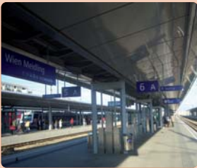
DER NEU UMGEBAUTE BAHNHOF MEIDLING