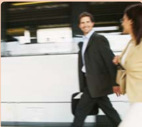
DIE FUNKTION DES SÜDBAHNHOFES ÜBERNIMMT DER BAHNHOF WIEN MEIDLING