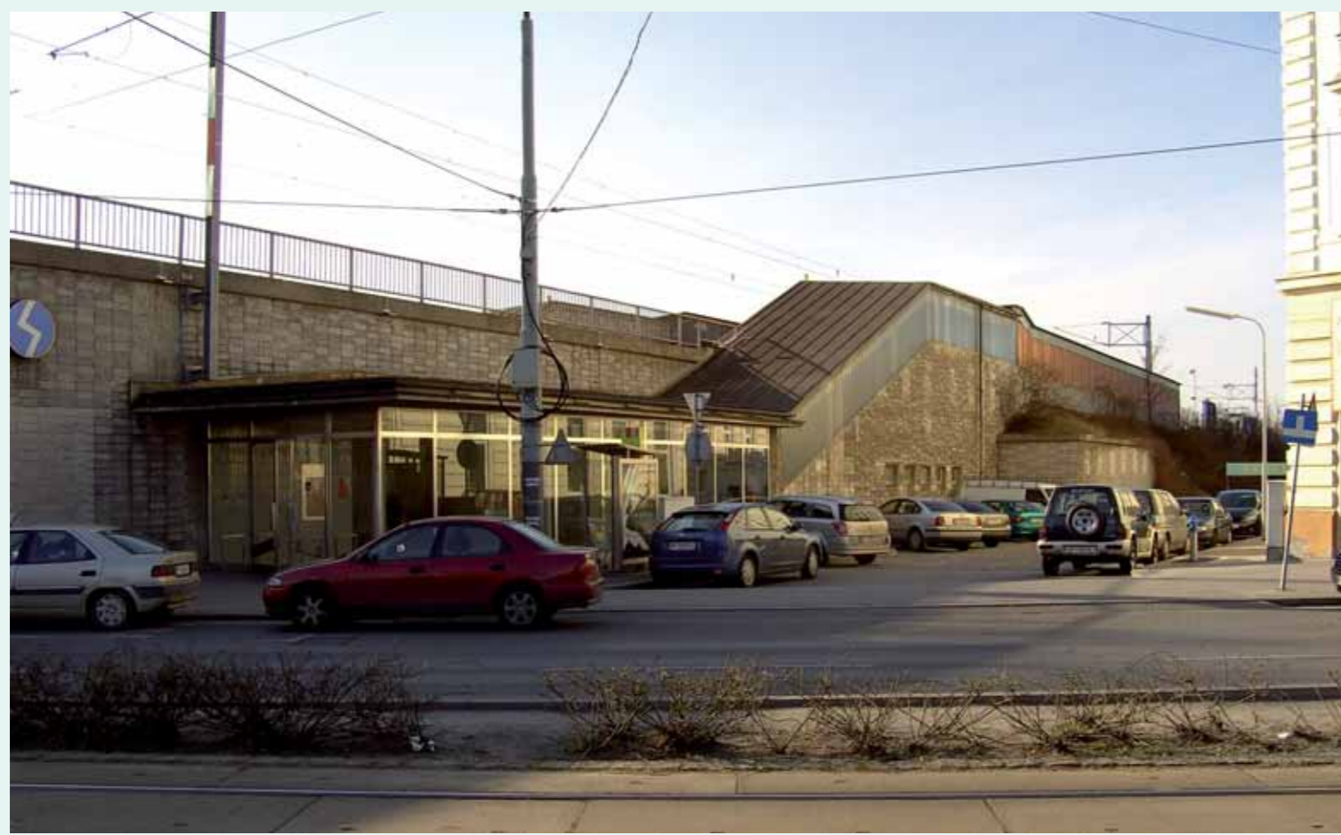
STATION BRÜNNER STRASSE HEUTE

Das neue Spital wird rund 850 Betten zählen und neue Standards setzen. Die Betriebsstrukturen werden eine moderne Bettenbelegung sowie einen flexiblen und zeitgemäßen Einsatz der Ambulanz- und Operationsbereiche gewährleisten.