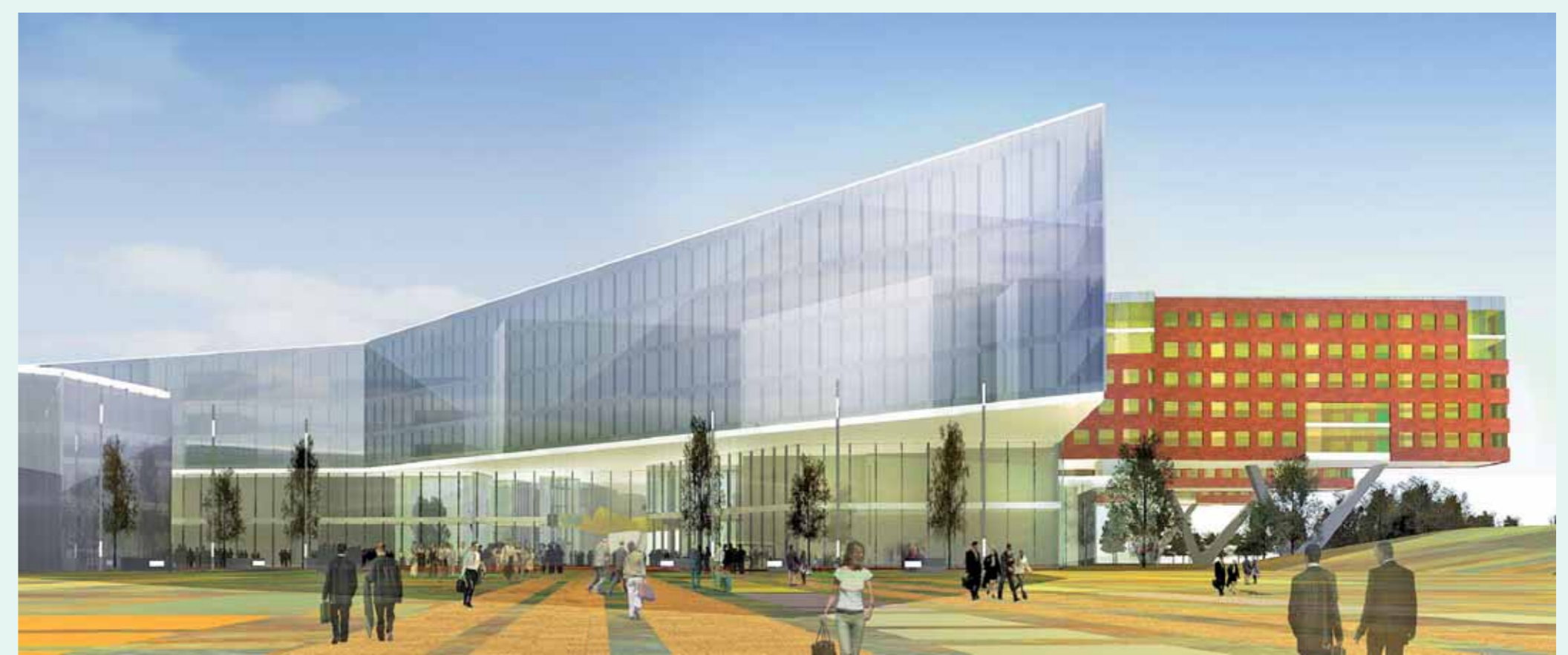
“PIAZZA” – ALS ATTRAKTIVER EINGANGSBEREICH VOM AUSGANGSPUNKT BRÜNNER STRASSE

Eine wichtige Begleitmaßnahme stellt auch der Umbau der S-Bahnstation „Brünner Straße“ dar. Das neue Krankenhaus Nord wird dadurch besser, attraktiver – vor allem behindertengerecht – an die S-Bahn angebunden.