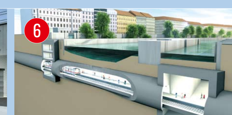
6 U2-STATION SCHOTTENRING Die erste U-Bahn-Station Wiens unter Wasser