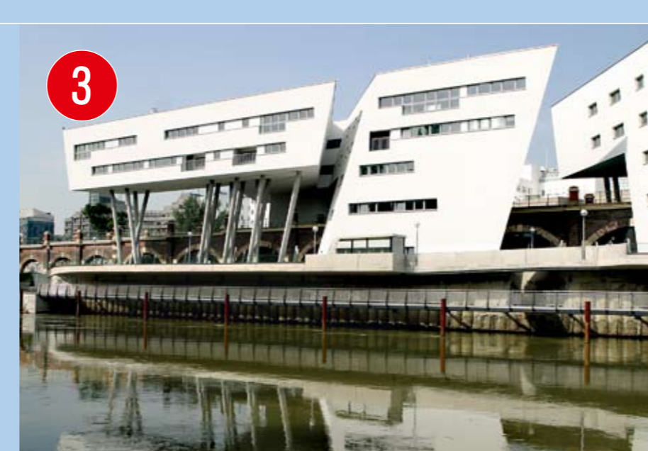
3 DAS HAUS DER STARARCHITEKTIN ZAHA HADID Eine architektonisch herausragende Anlage