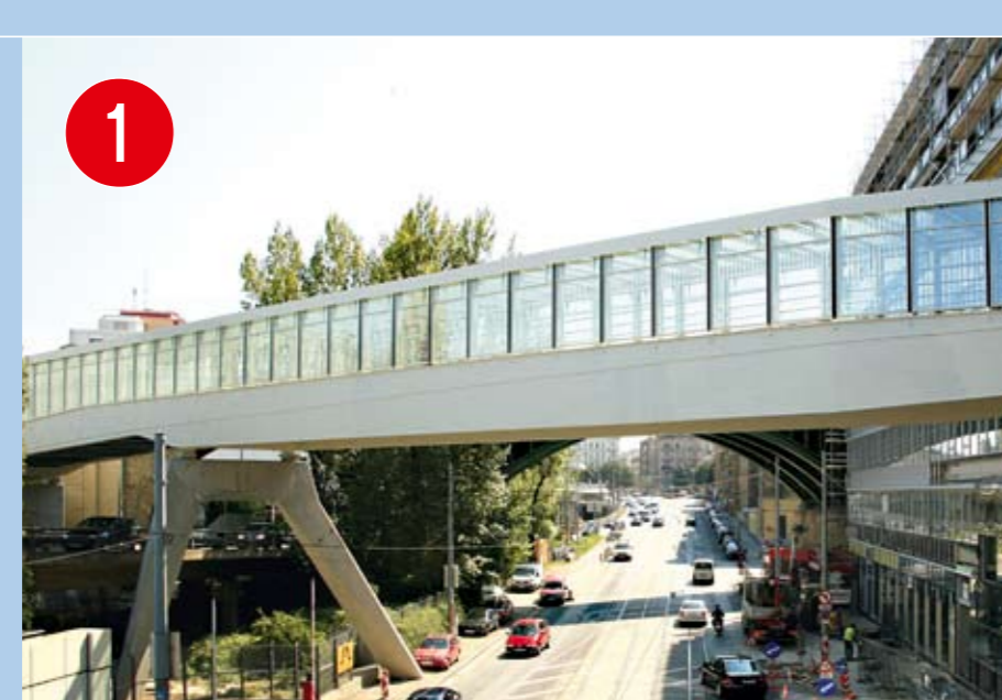
1 DER SKYWALK Barrierefreie Verbindung zwischen dem 9. und 19. Bezirk

Zu diesen bereits bekannten Projekten wie Summer Stage, Badeschiff, Twin City Liner oder Strandbar Herrmann sollen künftig weitere hinzukommen und das Angebot an Freizeit- und Erholungsmöglichkeiten für alle WienerInnen erweitern. So wurde zum Beispiel ein zweiter Twin City Liner, der 2009 eine neue Schiffsstation erhalten soll, in Betrieb genommen, ein Angebot für Kinder und Familien beim 2008 eröffneten Central Garden geschaffen, und beim FLEX soll neben dem 2007 eröffneten Pavillon ein neues Badeschiff vor Anker gehen.