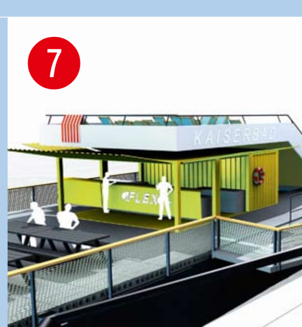
7 KAISERBAD-FLEX Der 75 Meter lange Frachtkahn mit Schwimmbecken, Sonnenterrassen und Gastronomie