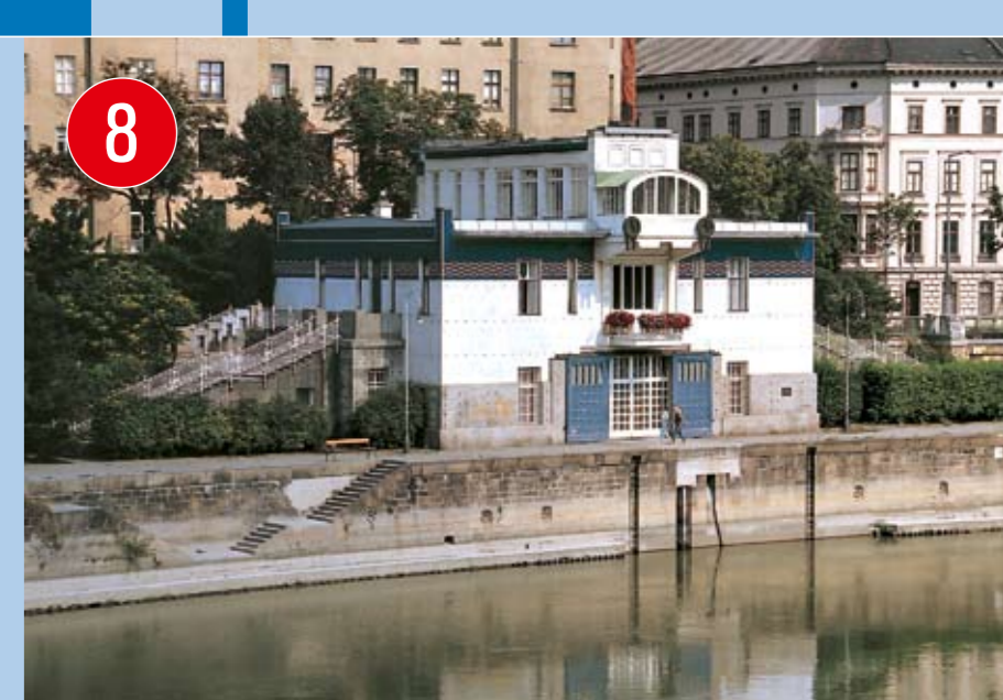
8 DAS KAFFEEHAUS AM WASSER OTTO WAGNERS SCHÜTZENHAUS MIT neuem Glanz und Inhalt