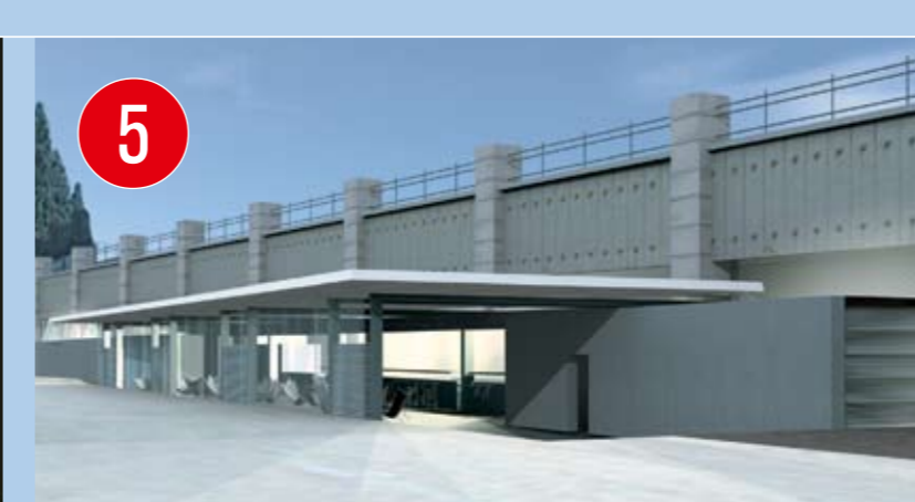
5 DAS FLEX NEU Das etablierte Szenelokal mit erweitertem Erscheinungsbild