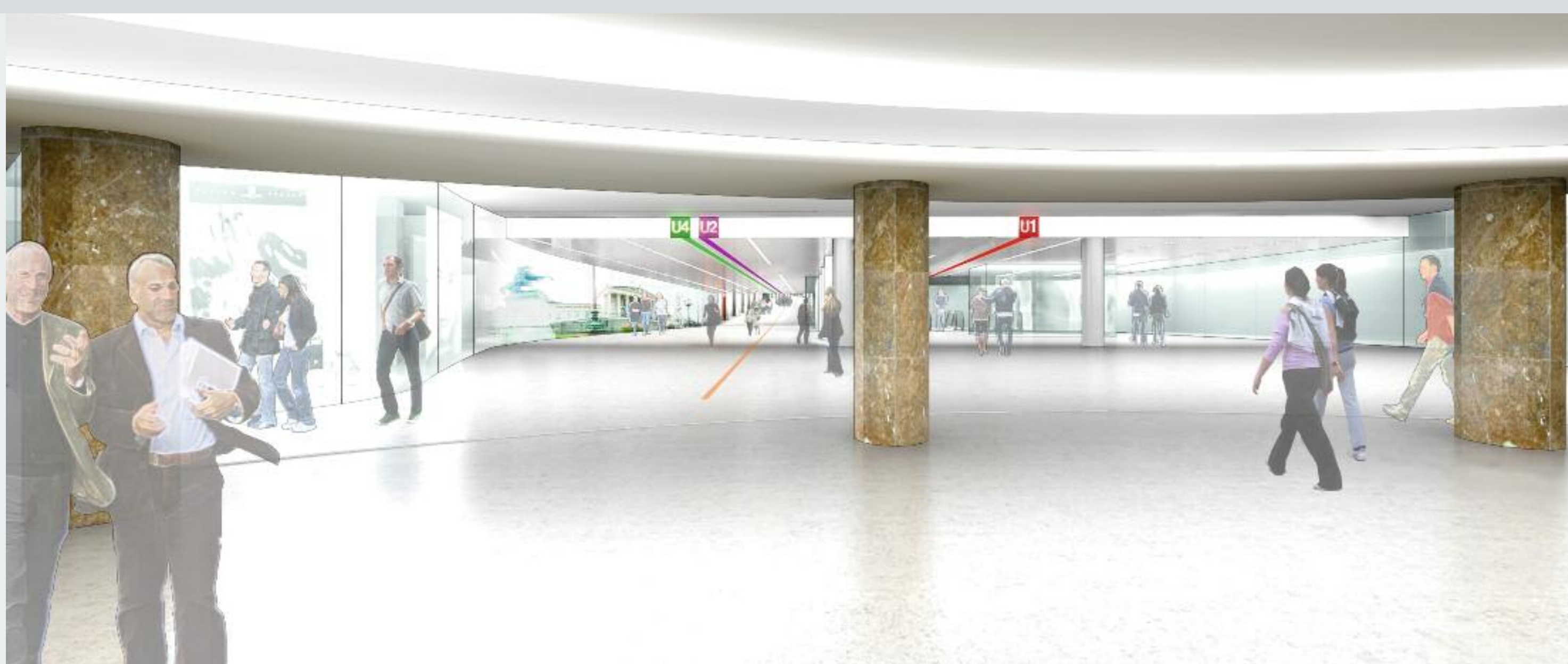
Blick Zugang U1