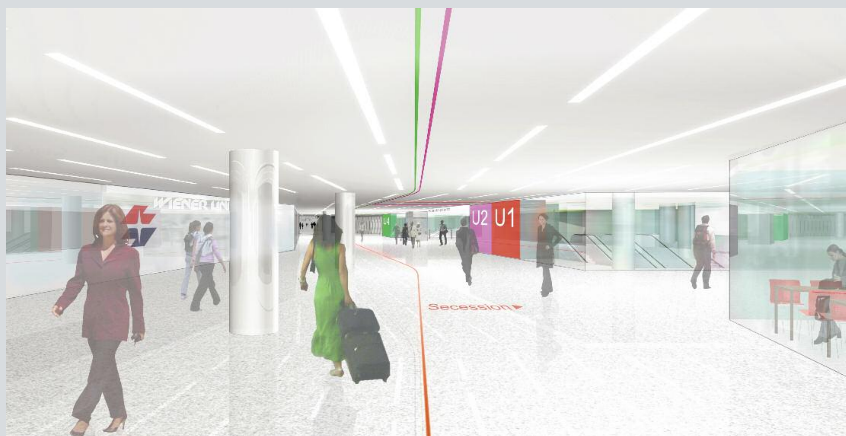
Blick in die Hauptpassage

Mit dem Umbau der in die Jahre gekommenen und den heutigen funktionellen Anforderungen nicht mehr entsprechenden Karlsplatz- und Opernpassage wird ein Bedeutungswandel von einer reinen Verkehrsstation zu einer Kulturpassage angestrebt, die der Bedeutung des Ortes in der Kulturhauptstadt Wien gerecht wird.