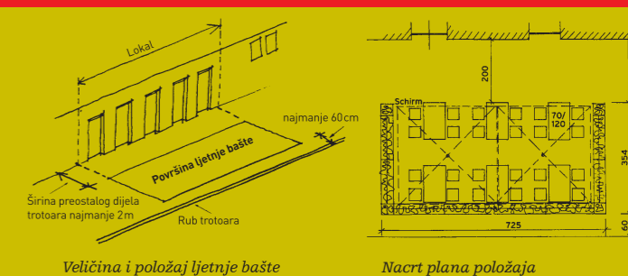
Veličina i položaj ljetnje bašte