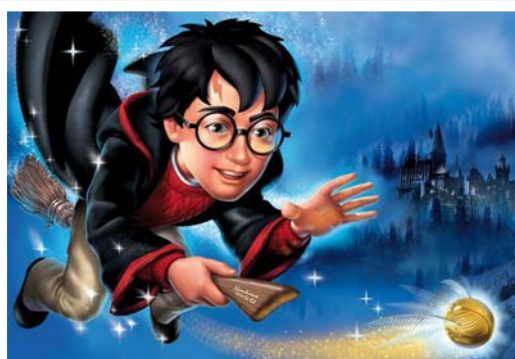
„Pflegekindern“ die bei Verwandten leben: Heidi, Harry Potter und die fromme Helene

Ein Thema war die „Verwandtenpflege“ in der Unterhaltungsindustrie immer schon.