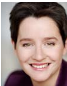
Mag.ª Sonja Wehsely Stadträtin für Gesundheit und Soziales